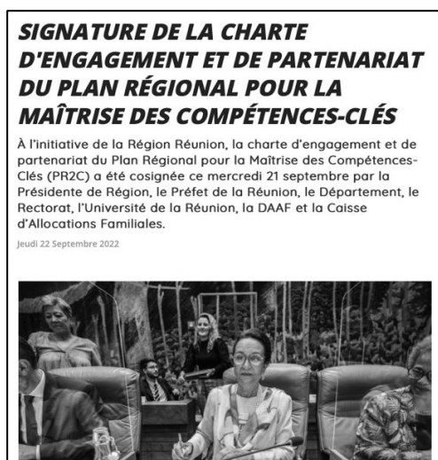
Figure 4 – Extrait de l'article du 22 septembre 2022 paru sur Zinfo974