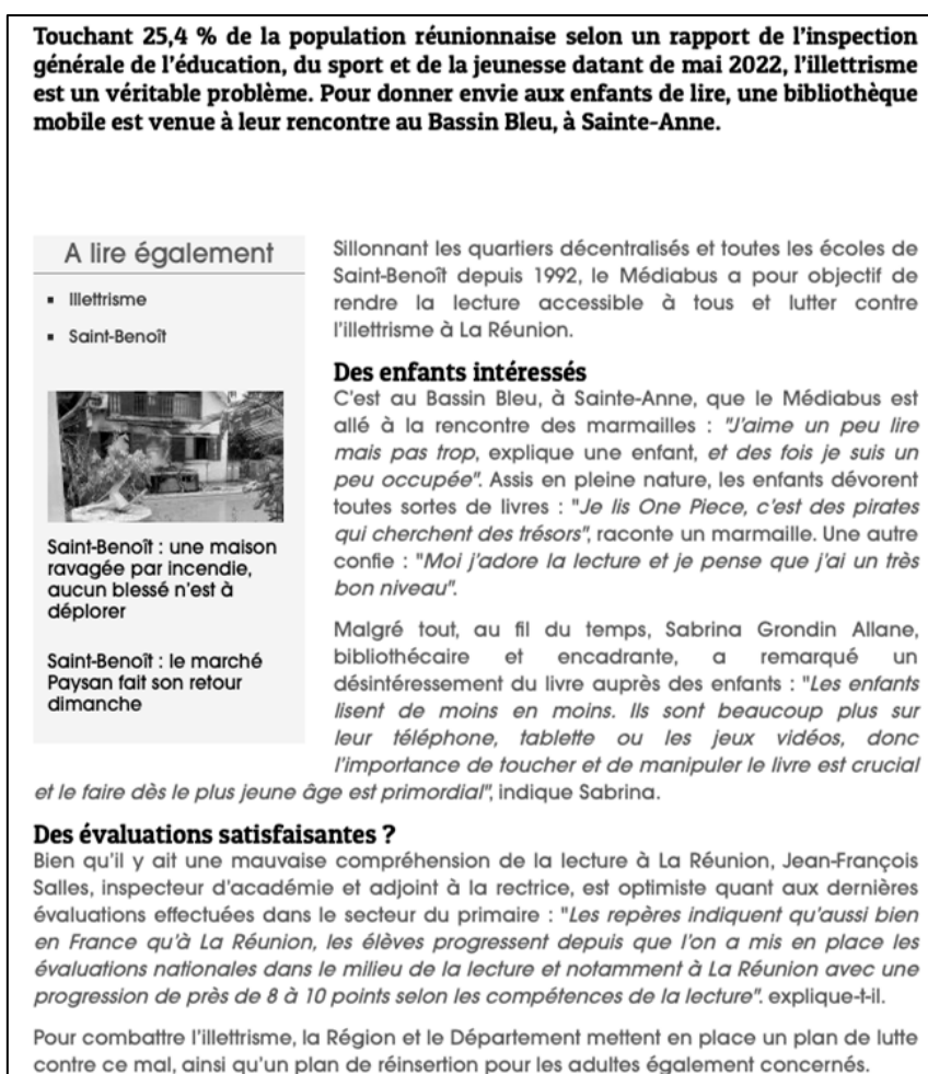
Figure 2 – Extrait de l'article du 4 juin 2022 paru sur Linfo.re