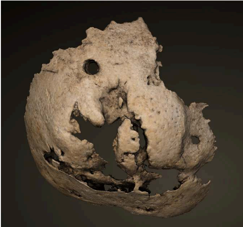
Fig. 2. – Maillage texturé (photogrammétrie) d'un os occipital pathologique de sujet immature (site altomédiéval de la Granède, Millau, Aveyron).