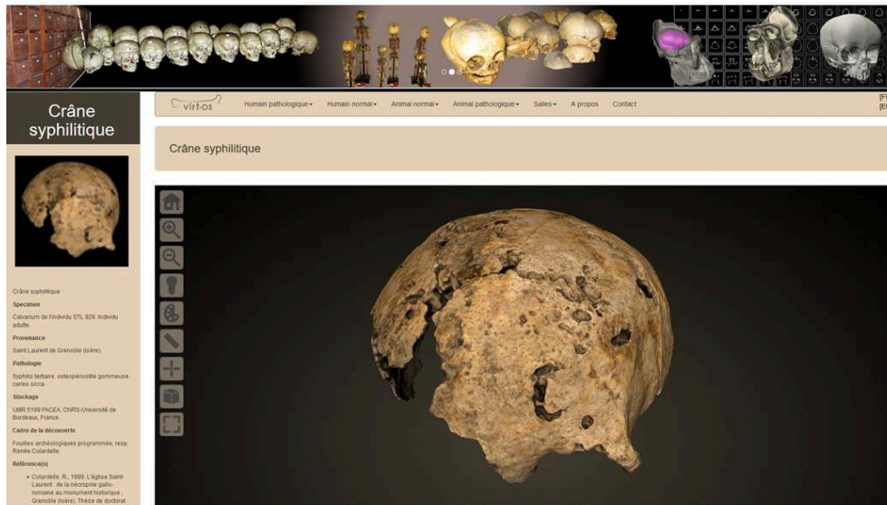
Fig. 1. – Exemple d'une page du site VIRT.OS montrant un modèle 3D de crâne et l'ensemble des fonctionnalités du viewer.

informations sur le spécimen original : provenance, contexte chronoculturel, lieu de dépôt / conservation, références bibliographiques (fig. 1).