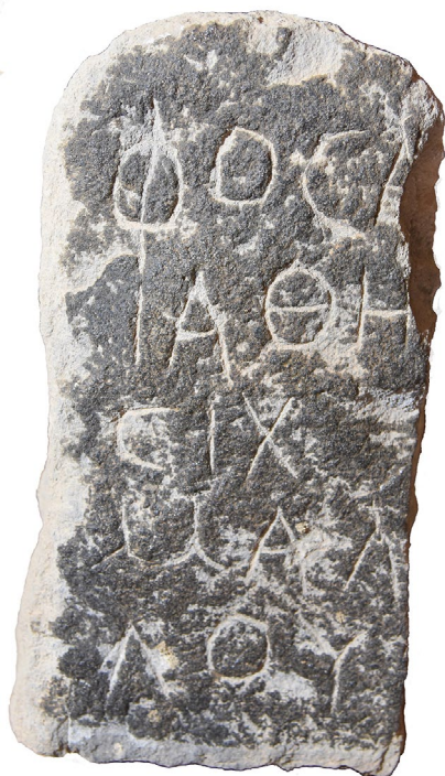
Fig. 5 : Stèle « païenne » de Samra, GATIER 1998, 368f. n° 7.

découvert une grande nécropole dont 692 tombes à fosse ou à ciste ont été fouillées (Fig. 9). 71 Cependant, on n'y connaît aucun tombeau monumental, mausolée ou hypogée. Ont été retrouvées et publiées environ 32 stèles « païennes », c'est-à-dire d'époque romaine, des II e , III e et peut-être IV e s. apr. J.-C., sans qu'on puisse être plus précis (Fig. 5). Ces stèles en basalte ou plus rarement en calcaire, parallélépipédiques ou parfois cintrées, du type du Hauran, 72 sans aucune trace de christianisme, portent des inscriptions en grec, absolument semblables à celles d'un village voisin, Rihab, ou à celles des sites environnants, comme Umm al-Jimāl. Le formulaire simple comporte en général le nom suivi du patronyme et de l'âge du défunt, mais parfois l'un des deux derniers éléments a disparu. Il arrive aussi que le texte soit légèrement plus développé, avec la mention d'une fonction ou d'un état comme celui de « vétéran », ou avec θάρσι, ou encore avec le participe ζήσας. On peut aussi ajouter à ces épitaphes « païennes » une poignée de stèles inscrites en nabatéen, avec le nom et le patronyme du défunt. 73 L'une des tombes non pillées, au mobilier bien préservé et