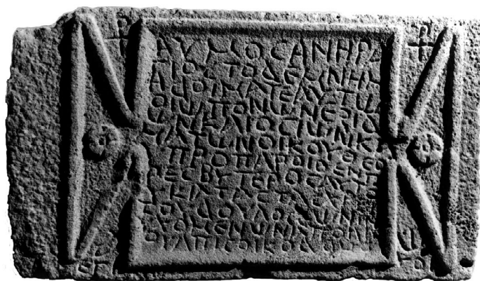
Fig. 8 : IGLS XV 268, de Harrân.

bulaire et le contenu des textes, en particulier les épigrammes, des indications permettant de reconnaître comme chrétiens les commanditaires des tombeaux ou les défunts. 96