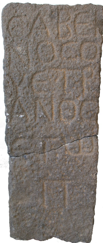
Fig. 7 : Stèle « païenne » d'Umm al-Jimāl, I.Jordanie V , 1 48.

téen, n'indiquant guère que le nom et le patronyme du défunt, sans son âge. Cette abondance d'épithaphes s'explique entre autres par le hasard des conditions de préservation : le déplacement et le remploi comme matériaux de construction dans les bâtiments du bourg romano-byzantin de blocs provenant d'un premier village nabatéo-romain abandonné, qui se trouvait immédiatement à côté du nouveau bourg. Sur l'ensemble considérable des stèles, on ne peut considérer comme chrétiennes que deux d'entre elles qui sont ornées de croix. L'une comporte la formule d'encouragement développée, « Courage, Léontia, sur terre personne n'est immor-