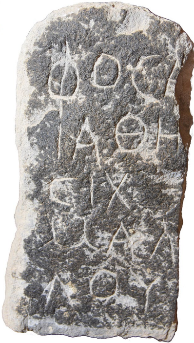
Fig. 5 : Stèle « païenne » de Samra, GATIER 1998, 368f. n° 7.

découvert une grande nécropole dont 692 tombes à fosse ou à ciste ont été fouillées (Fig. 9). 71 Cependant, on n'y connaît aucun tombeau monumental, mausolée ou hypogée. Ont été retrouvées et publiées environ 32 stèles « païennes », c'est-à-dire d'époque romaine, des II e , III e et peut-être IV e s. apr. J.-C., sans qu'on puisse être plus précis (Fig. 5). Ces stèles en basalte ou plus rarement en calcaire, parallélépipédiques ou parfois cintrées, du type du Hauran, 72 sans aucune trace de christianisme, portent des inscriptions en grec, absolument semblables à celles d'un village voisin, Rihab, ou à celles des sites environnants, comme Umm al-Jimāl. Le formulaire simple comporte en général le nom suivi du patronyme et de l'âge du défunt, mais parfois l'un des deux derniers éléments a disparu. Il arrive aussi que le texte soit légèrement plus développé, avec la mention d'une fonction ou d'un état comme celui de « vétéran », ou avec θάρσι, ou encore avec le participe ζήσας. On peut aussi ajouter à ces épitaphes « païennes » une poignée de stèles inscrites en nabatéen, avec le nom et le patronyme du défunt. 73 L'une des tombes non pillées, au mobilier bien préservé et