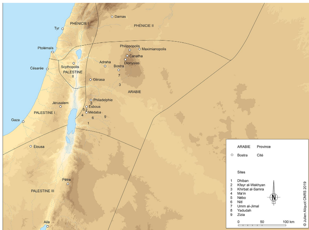
Fig. 1: La province protobyzantine d'Arabie dans ses frontières du milieu du V e s. apr. J.-C.

ont du sens et que la création du patriarcat de Jérusalem en 451 apr. J.-C. a institué ou conforté une forte séparation entre l'Arabie, restée soumise au patriarche d'Antioche, et les trois provinces de Palestine, dépendantes de Jérusalem. La province d'Arabie, recentrée autour de Bostra à partir de la deuxième moitié du V e s. apr. J.-C., est cohérente, géographiquement et culturellement (Fig. 1). Rappelons pour la bonne compréhension de la situation, que la chôra de la cité de Bostra est particulièrement vaste et qu'elle s'étend loin vers le sud, à l'intérieur de l'actuelle Jordanie, en englobant des sites archéologiques importants, comme Rihab, Khirbat al-Samra 10 et Umm al-Jimāl, tous trois riches d'inscriptions.