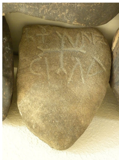
Fig. 6 : Stèle chrétienne de Samra, NABULSI et al. 2014, 151f.

Le type des épitaphes chrétiennes de Samra est original, avec des blocs négligés et peu taillés, des textes émaciés, un répertoire décoratif de croix bien particulier et surtout l'usage de l'ara-