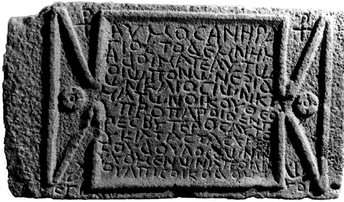
Fig. 8 : IGLS XV 268, de Harrân.

bulaire et le contenu des textes, en particulier les épigrammes, des indications permettant de reconnaître comme chrétiens les commanditaires des tombeaux ou les défunts. 96