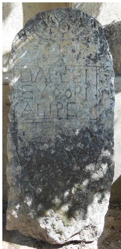
Fig. 3 : Stèle de Madaba, PICCIRILLO 1989, 109f. n° 1.

Par ailleurs, le Père Michele Piccirillo avait eu le mérite de repérer dans les sites de cette région méridionale de l'Arabie chrétienne quelques stèles anépigraphes gravées d'une croix, parfois très simple, parfois élaborée, et il les avait publiées, alors que ce type d'objet passe en général totalement inaperçu. Au moins deux avaient été trouvées à l'extérieur du monastère du Mont Nébo ; cinq provenaient de Madaba, une de Fay-saliyah/Kufeir al-Wakhyan, une de Nitl, au moins treize de Zizia et une de Yadudeh, plus au nord. 59 Il est probable que beaucoup de stèles anépigraphes ont échappé à l'œil des observateurs, mais, dans le pays de Moab, R. Canova en avait signalé et elle avait photographié un grand ensemble provenant du site de Maḥaiy. 60