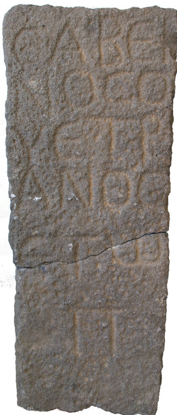
Fig. 7 : Stèle « païenne » d'Umm al-Jimāl, I.Jordanie V , 1 48.