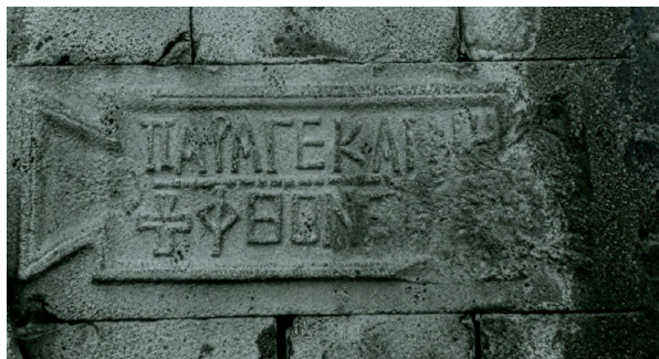
Fig. 2 : I.Syrie 2406, de Majdal an-Naidat.

est vain de chercher un caractère « crypto-chrétien » à ἐνθάδε κίτε. 45 En revanche, certains mots comme les deux verbes ἀναπαύομαι et κοιμῶμαι, avec le sens de « se reposer », ainsi que des noms construits sur les mêmes racines, appartiennent typiquement au vocabulaire chrétien. Le terme ἀνάπαυμα, « repos, lieu de repos », dans une épigramme gravée sur un linteau et datée de 419–420 apr. J.-C., à Salkhad dans le Hauran, me paraît un bon indice de christianisme pour cette « inscription de fondation » discutée. 46