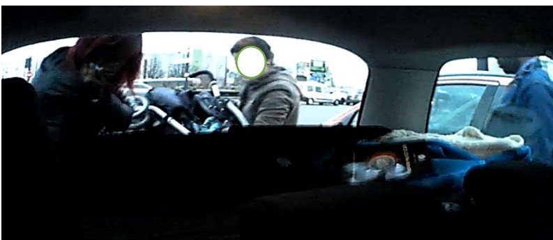
Photo 5 : Le bébé est installé dans son siège-auto, la conductrice range la poussette dans le coffre avec la femme aperçue plus tôt dans la séquence.

Puis Alexia observe que l'homme et la femme s'embrassent et se saluent avant de se quitter (photo 6). Alexia boucle sa ceinture.