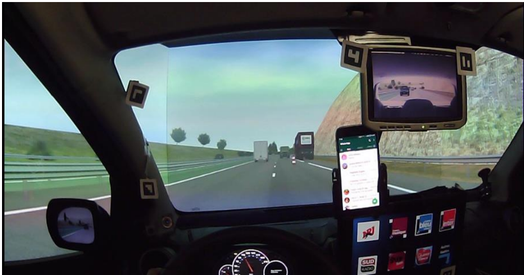
Figure 2 : Situation d'évitement d'obstacle sur autoroute

En hands-off, la distance aux obstacles (plus précisément le temps à l'obstacle combinant distance et vitesse) quand la voiture se déporte sur la voie de droite est inférieure ( p < 0,05 ) par rapport à Hands-on, ce qui signifie que les conducteurs se déportent un peu plus tardivement pour éviter l'obstacle, la réactivité et les marges de sécurité sont donc moindres (temps moyen minimum à l'obstacle de 3 sec. en hands-on et de 2,4 sec. en hands-off). 12