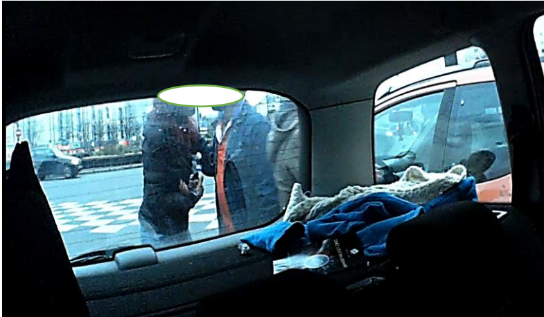
La femme vue plus tôt à l'arrière de la voiture, ouvre la portière du côté d'Alexia (photo 7). Photo 7 : Une nouvelle passagère ouvre la porte arrière droite, du côté d'Alexia, et se penche pour rentrer dans la voiture.