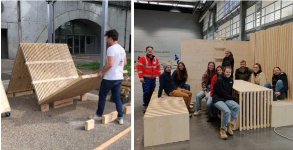
Figure 3 : Expérimentations constructives aux Grands Ateliers : à gauche workshop avril 2022 (pré-prototype) ; à droite workshop décembre 2023 (mobilier pour prototype fonctionnel)

Les workshops sont des occasions pour les étudiants de mettre leurs idées à l'épreuve de la matière et de se frotter aux exigences de la construction en faisant. En début d'année, le Dem organise pour les M2 une « mise à niveau bricolage » par un micro-workshop collectif de deux jours permettant à chacun de se familiariser avec les outils de production disponibles au Acklab 3 de l'ENSAL et aux Grands Ateliers. En support et relais des compétences étudiantes parfois limitées en termes de fabrication, les enseignants peuvent faire appel à des intervenants extérieurs multiples. Lorsqu'il s'agit d'artisans menuisiers ou charpentiers, le workshop permet aux étudiants de développer leurs savoir-faire mais surtout d'introduire le sujet de la relation concepteur-fabriquant généralement très peu abordée dans le cadre des études d'architecture à dominante théorique.