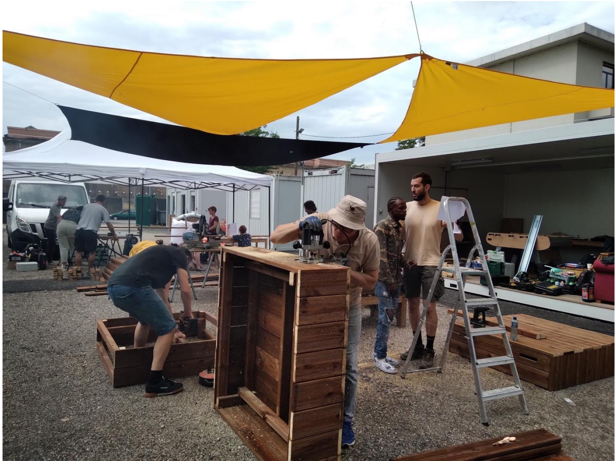
Figure 4 : Création d'aménagements sur le site d'hébergement d'urgence La Station géré par l'association Le Mas mené avec les résidents en collaboration avec le collectif Pourquoi Pas

Dans le projet « Architecture de l'hospitalité » mené au deuxième semestre de M1 2021-22, l'équipe étudiante et enseignante collabore avec l'association Le Mas sur les aménagements extérieurs et la création d'espaces communs pour La Station, une résidence d'hébergement d'urgence à destination de mineurs réfugiés. Le financement par la Métropole de Lyon permet au collectif d'architectes « Pourquoi Pas ? » d'accompagner l'ensemble du projet et en particulier la co-conception et la réalisation des aménagements avec les résidents sur le terrain. L'ensemble des activités menées ont été le support de partages des points de vue sur le projet entre les résidents, les gestionnaires de sites et les collectivités publiques. L'expérimentation prend une dimension sociale en confrontant directement sur le terrain les idées aux contraintes physiques, matérielles et humaines qui conditionnent la transformation du lieu dans le temps imparti.