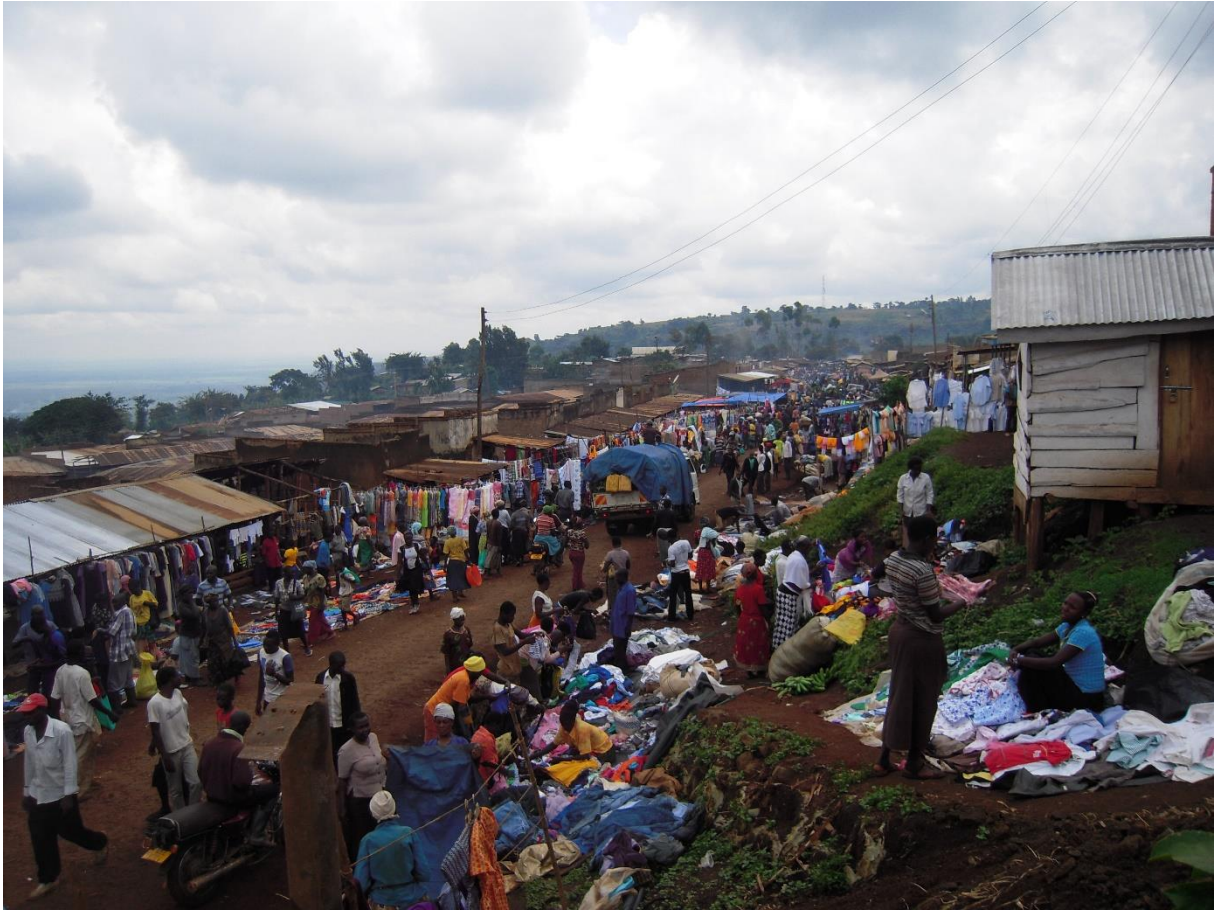
Fig. 2. Section de la fripe au marché de Kamus, mont Elgon, Ouganda. Racaud 2016

La fripe de deuxième choix (suspendue) ou troisième choix (au sol) représente une part importante du commerce dans les marchés ruraux, ces produits sont adaptés au pouvoir d'achat de la clientèle locale, majoritairement pauvre.