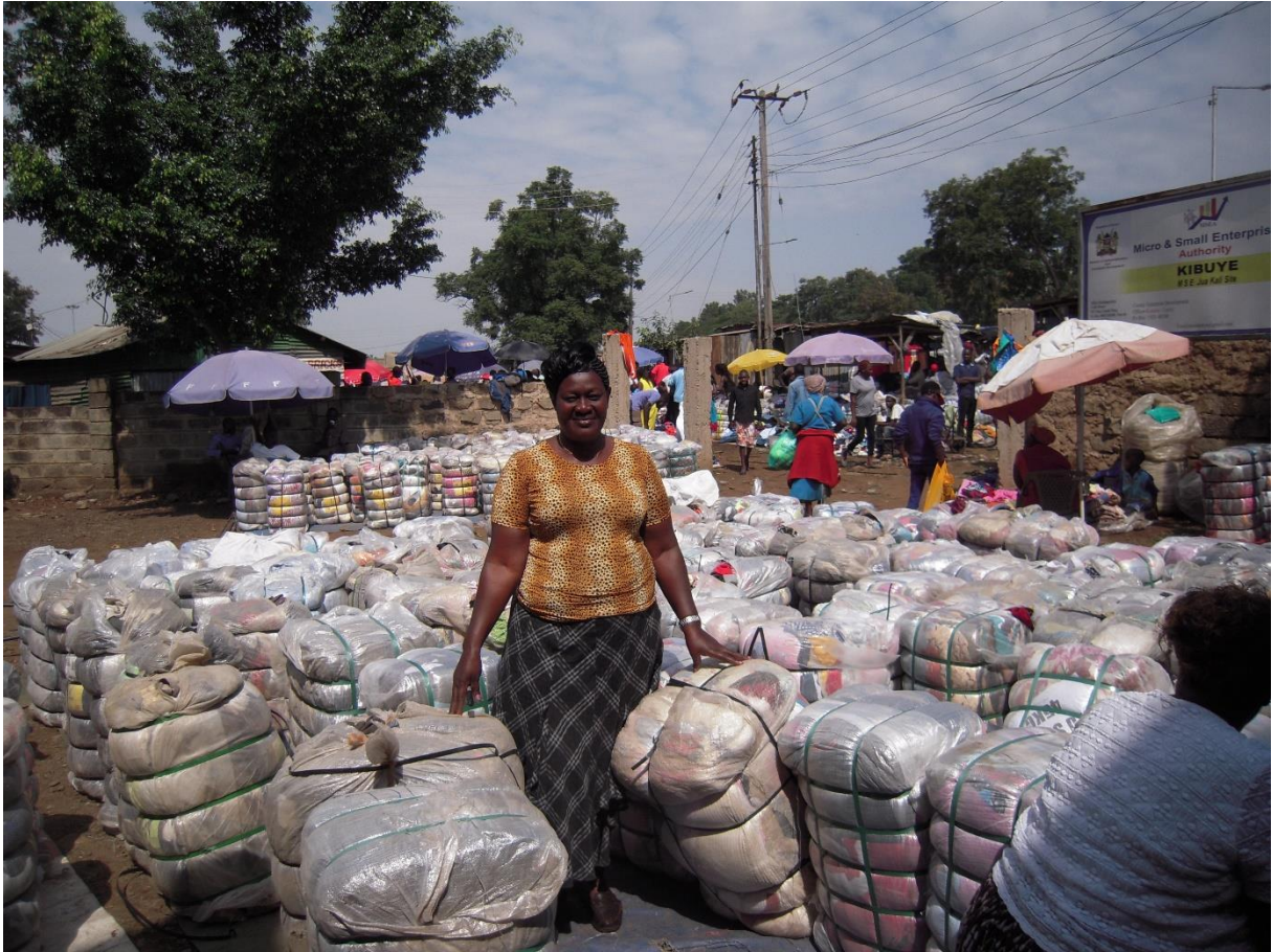
Fig 5. Une grossiste en fripe de Mombasa, sur le marché de Kibuye à Kisumu, Kenya (Racaud 2016)