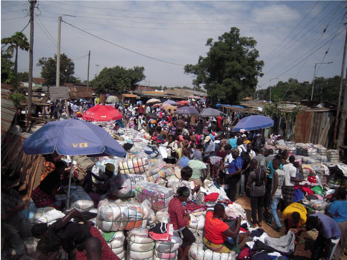
Fig 6. Vente au détail ou demi-gros au marché Kibuye, Kisumu, Kenya (Racaud 2016)

En provenance de Mombasa (parfois via Nairobi), la fripe est diffusée dans le réseau urbain et de marchés ruraux de l'ouest kényan à partir de Kibuye. Les balles achetées aux grossistes par des commerçants d'envergure moindre, sont ensuite déballées par d'autres plus petits commerçants ou des clients, qui font ainsi le tri.