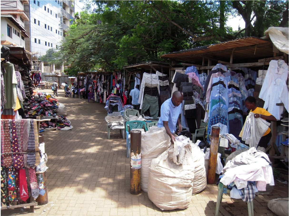
Fig. 1. Commerces de la fripe de premier choix à Kisumu, Kenya. Racaud 2016

Les vêtements proposés par ces commerçants en centre-ville sont de la fripe de premier choix, le « haut de gamme », la clientèle est notamment composée d'employés hommes d'âge mûr du centre-ville.