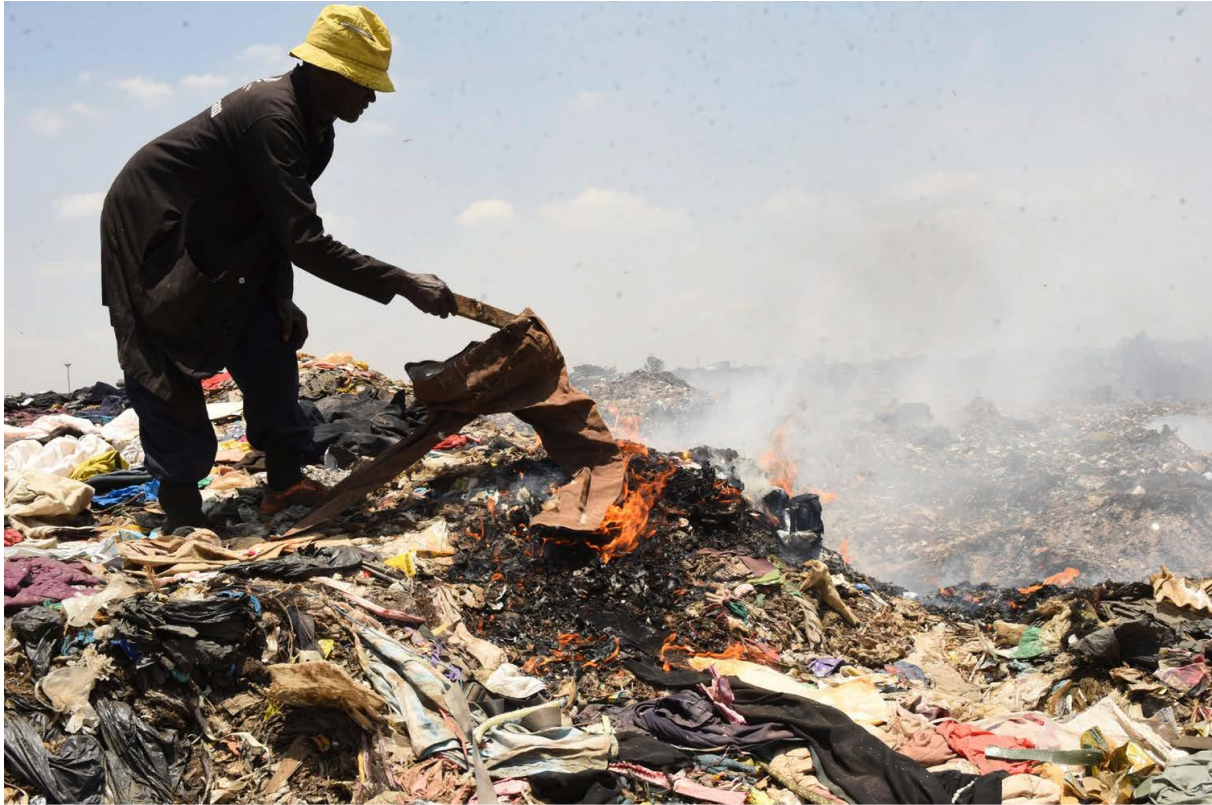
Fig.7. Combustion de vêtements usagés dans la décharge de Dandora (Changing Markets Foundation. 2023, p. 38)