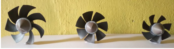
Figure 3 - Turbine n°3, n°2 et n°1 de gauche à droite.

Des hélices de type Savonius compatible pour le vent, ont été recyclées (figure 3). Un trou au centre de l'hélice a été fait pour insérer l'axe du rotor et devant ce dernier, nous avons fixé un cône avec une colle bougie.