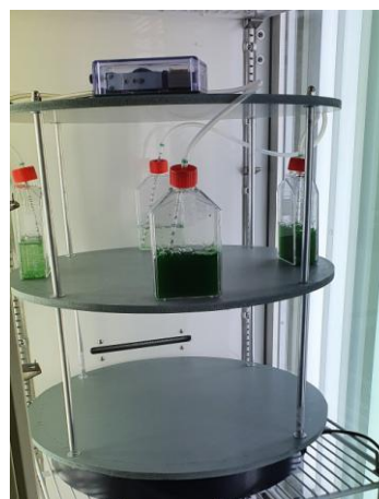
Fig.1 : Montage expérimental

Les cultures sont homogénéisées par bullage à l'aide d'une pompe à air sur batterie pour permettre la rotation (fig.1).