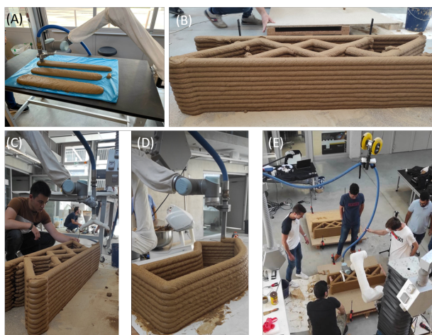
FIGURE 1 – Impression de cordons; Impression finale double buse; Impression double et simple buse