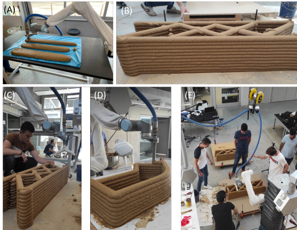
FIGURE 1 – Impression de cordons; Impression finale double buse; Impression double et simple buse