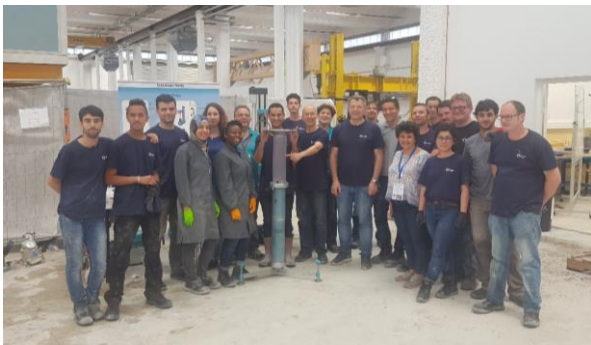
Figure 1 – Participants aux essais du RRT

Comme l'ont démontré deux campagnes d'essais interlaboratoires (RRT) réalisées au LCPC à Nantes (octobre 2001) et au NIST à Cleveland (avril 2003), différents rhéomètres à béton peuvent donner des résultats différents. Une nouvelle campagne a donc été réalisée à l'IUT de Béthune en 2018, axée sur des mélanges de béton plus fluides et différents procédés. Ces nouveaux essais interlaboratoires ont réuni sur deux jours 23 participants (Figure 1) de différents pays autour de nouveaux dispositifs rhéologiques, tels que les rhéomètres ICAR, Viskomat XL, eBT-V, Rheocad, BML 4 SCC, ainsi que des instruments spécifiques tels que le Sliper, rhéomètre d'interface et tribomètre. Cinq Bétons fluides et trois mortiers ont été livrés par toupie (Société EQIOM) jusqu'au laboratoire de recherche (LGCgE) de l'IUT de Béthune.