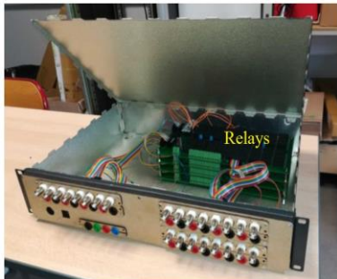
Figure 3 – Matrice de relais pour les TP d'électronique.

distance d'un jeu de relais permet la réalisation d'un montage électronique instrumenté. L'interface un mode de câblage manuel où tous les relais peuvent être activés par l'utilisateur et un mode de câblage automatique permettant de télécharger un montage prédéfini.