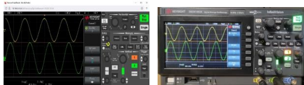
Figure 5 – Face-avant virtuelle (gauche) et réelle (droite) d'un oscilloscope.

La prise de contrôle des instruments pour générer des signaux et réaliser des mesures s'effectue en se connectant au serveur de face-avant intégré aux instruments. Notons que ces faces-avant virtuelles reproduisent de façon souvent très réaliste les vraies faces-avant des instruments (Fig. 5.).