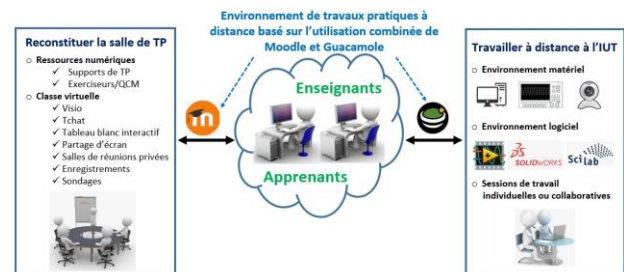
Figure 2 – Architecture logicielle du cartable distant.

Pour guider les utilisateurs dans l'utilisation de la plateforme, nous avons rassemblé l'ensemble des informations utiles dans un Wiki [3].