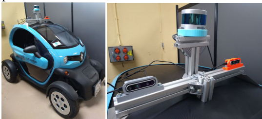
FIGURE 1 – Plateforme technologique pour le transfert recherche-enseignement en perception multi-capteurs embarquée.

Dans la suite du document, le cadre pédagogique de cette expérience de transfert recherche-enseignement est présenté en Sec. 2. Elle est suivie, d'une description de la plateforme technologique associée en Sec. 3. En Sec. 4, le choix de concepts abordés et la démarche pédagogique sont présentés avec une suite de résultats obtenus en section 5. Enfin, le document est finalisé par quelques conclusions et perspectives du travail effectué.