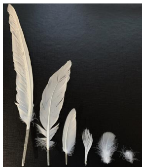
Figure 1 – Plumes de canards

Les plumes de canards, visibles sur la figure 1, sont récupérées et nettoyées afin d'éliminer les bactéries qu'elles comportent. Le nettoyage s'effectue à l'aide d'un savon naturel et d'une étape de désinfection à l'éthanol. Par la suite, les plumes sont broyées en morceaux de quelques millimètres (~5mm) pour pouvoir être utilisées plus facilement et faciliter l'étape suivante d'extraction de protéines.