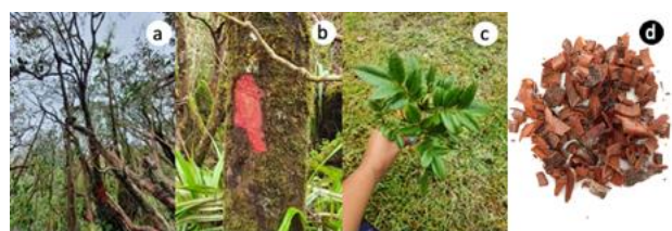
Figure 1. Weinmannia tinctoria . a : arbre ; b : récolte d'écorce ; c : feuille ; d : écorce séchée

Les espèces du genre Weinmannia endémiques à La Réunion (2) et à Madagascar (28) sont répertoriées dans le Tableau 1 [3]. Leur classement sur la liste rouge de l'IUCN (Union Internationale pour la Conservation de la Nature) y est également renseigné [4]. À ce stade de l'étude, seule Weinmannia tinctoria , une espèce endémique de La Réunion, a été collecté dans la forêt de Notre Dame de La Paix ( Figure 1 ).