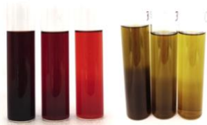
Figure 2. Extrait liquide d'écorces de W. tinctoria (gauche) et de feuilles (droite).

La méthode d'extraction par ASE à 70% d'éthanol a été utilisée pour la production d'extraits colorants issus des écorces et des feuilles de W. tinctoria (Figure 2). Les rendements d'extrait sec à partir de la matière sèche végétale sont de 16,9% et de 18,1% respectivement.