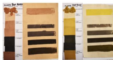
Figure 4. Test de teinture des extraits d'écorce (gauche) et de feuille (droite) de W. tinctoria sur coton et laine.

l'extrait de feuille dans les teintes noires verdâtre et jaunes (Figure 4).