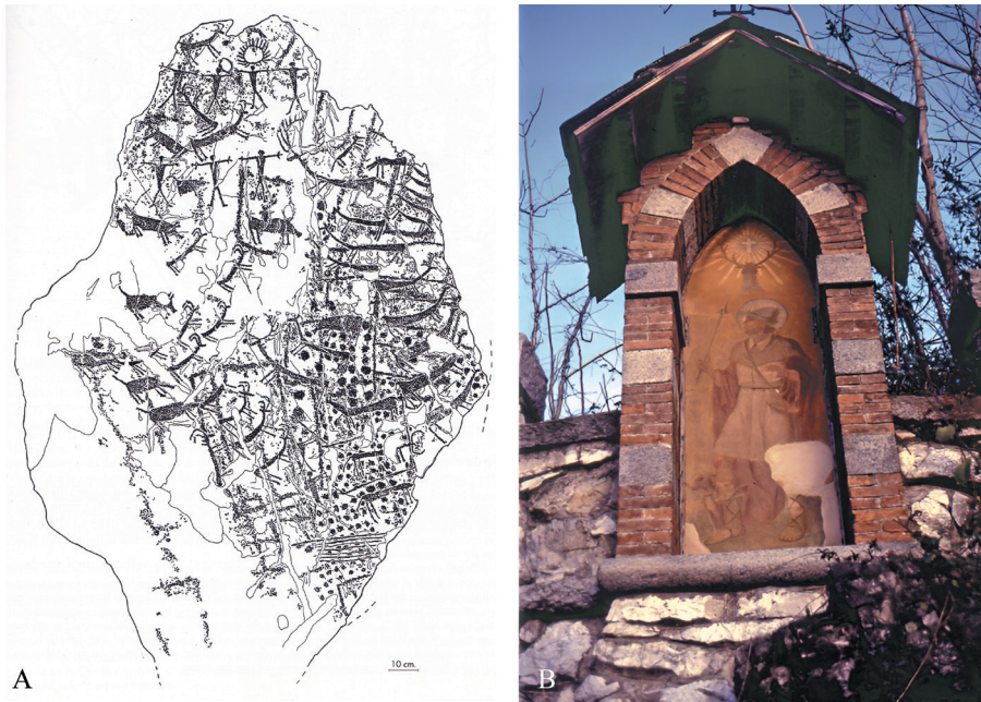
Fig 4. Assonanza grafica e tensione semantica tra il palco di cervo e la circonferenza raggiata del sole. A sinistra, Ossimo 8 (da Casini, 1994). A destra, fotografia di una piccola cappella votiva ottocentesca raffigurante San Glisente e il cervo luminifero (da Camuri, 2021).