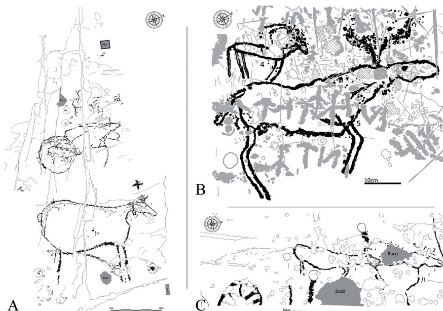
Fig 1. Cervidi della R6 di Luine (rilievi: Coop. Archeologica Le Orme dell'Uomo): A) il settore B con il grande cervo. Poco sopra si riconoscono degli alci incompleti; B) porzione del settore H con la più celebre raffigurazione d'alce e uno stambecco; C) altro dettaglio del settore H con due alci in linea.

Secondo il recente lavoro di Sigari e Forti (2022) l'arte rupestre di questo orizzonte cronologico rivelerebbe una scelta indirizzata alla non pubblicità delle figure, seppur siano poste su rocce dalle quali si ha un ottimo controllo del territorio: dalla R34 verso il lago di Iseo, dalla R6 sul fiume Oglio e il fondo valle.