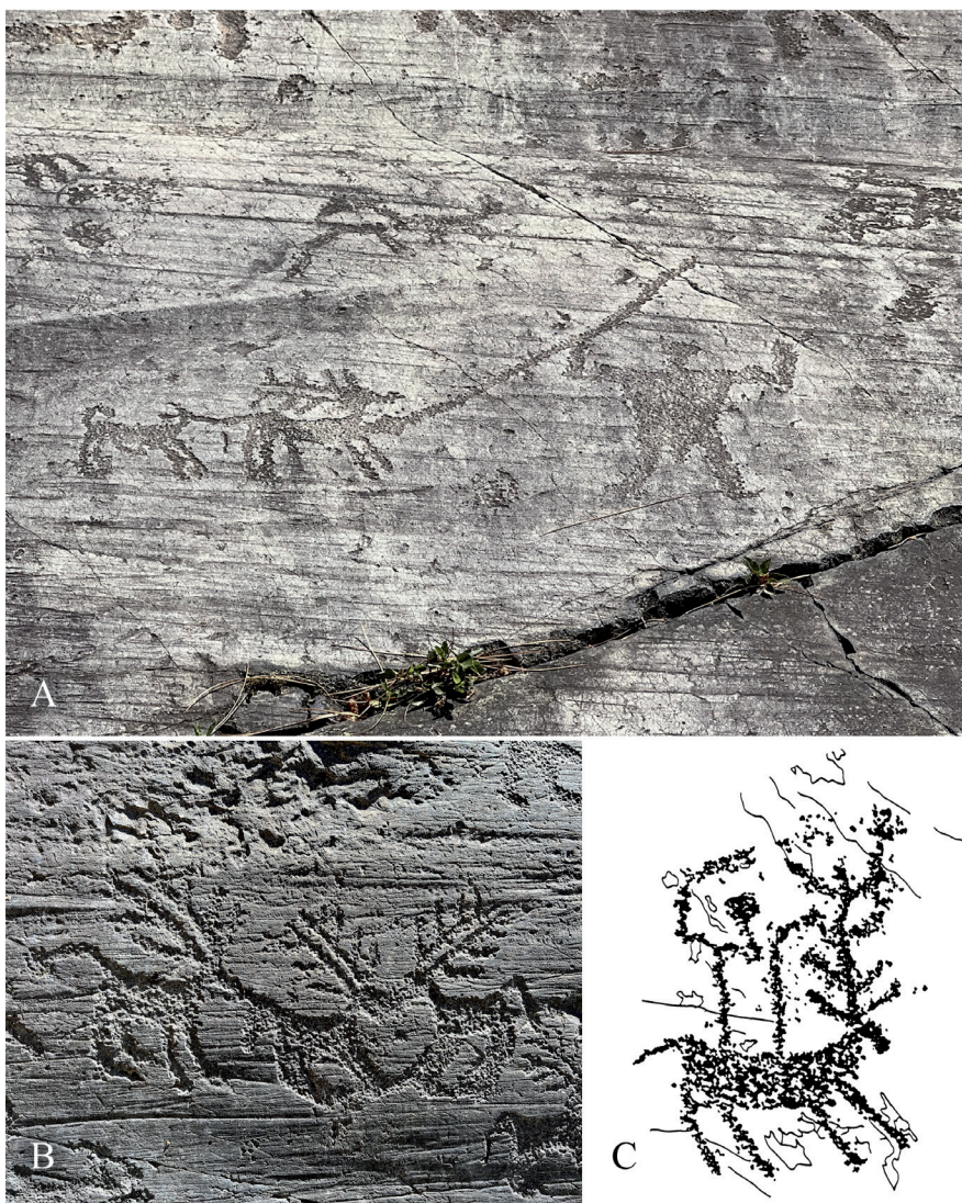
Fig 3. Sintesi delle modalità d'interazione tra cervi e antropomorfi nelle incisioni rupestri della Valcamonica dell'età del Ferro. (A) scena di caccia al cervo sulla R1 di Naquane (foto: G. Pessina); (B) tritico di cervi sulla R4 di In Valle (foto: G. Pessina); (C) cavalcatura di cervo sulla R57 di Naquane (da Fossati, 1991).

Il cacciatore solitamente è ritratto nell'atto di scagliare la lancia (o spada, bastone) impugnata in una mano e sollevata contro la preda, mentre l'uso di arco e frecce è limitato ad alcuni esempi della prima età del Ferro, a Campanine (R16) e Seradina (R12 e R18) (Abenante e Marretta, 2007).