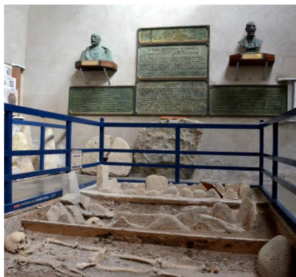
Figure 2. Aussi à l'origine du Laboratoire d'Anthropologie préhistorique fondé par Pierre-Roland Giot, le Musée préhistorique finistérien à Penmarc'h. Intérieur du Musée, vue des plaques commémoratives et des bustes des principaux fondateurs. Au premier plan, des sépultures de Saint-Urnel reconstituées.