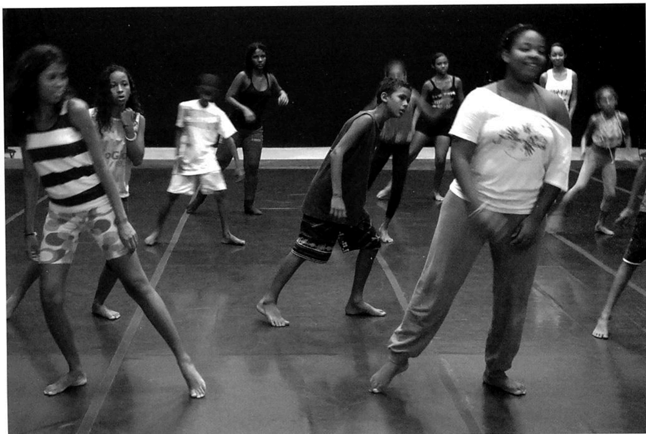
École libre de danse de la Maré.

certains déjà professionnels, d'autres beaucoup plus débutants, venus de tout le pays, sont recrutés, venant de milieux sociaux différents 24 . Assurer une telle ambition sans subvention pérenne, et en cherchant aussi des soutiens à l'étranger, notamment en France, n'est pas, on s'en doute, chose aisée. Jusqu'en 2016, environ 50% des dépenses fixes de la compagnie furent assurées par des fonds brésiliens 25 ; depuis, la compagnie ne bénéficie d'aucune aide de ce type, mais d'aides temporaires