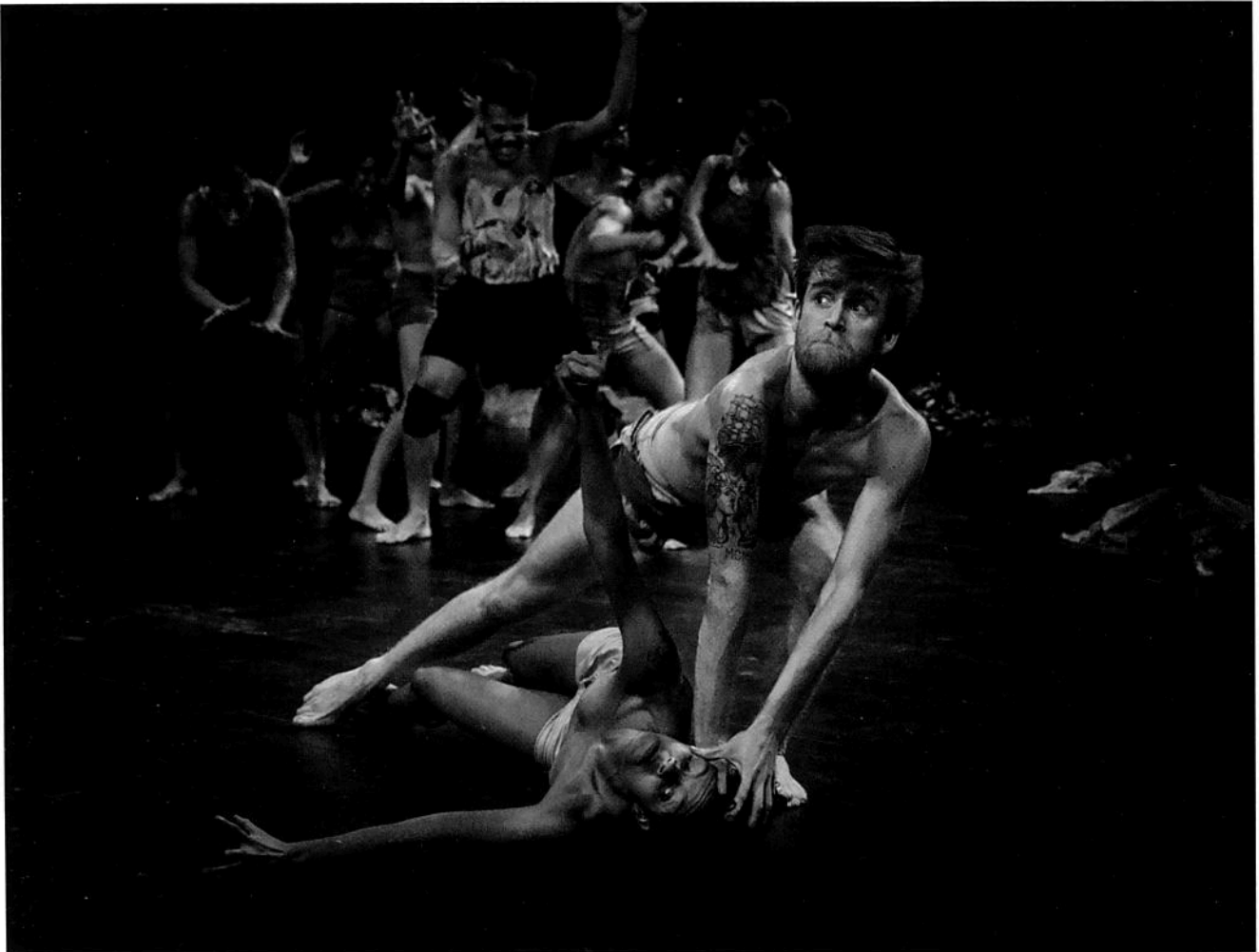
Fúria, chorégraphie Lia Rodrigues, 2018.