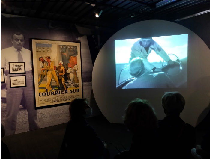
Fig. 6. Différents documents permettant de présenter les débuts de l'aviation et le rôle d'Antoine de Saint-Exupéry.

La sixième séquence, sobrement intitulée « Le manuscrit », fait quant à elle la part belle aux dessins et aux feuillets originaux conservés à la Morgan Library & Museum de New York et présentés pour la première fois en France. Suivant la narration de l'ouvrage, ces feuillets sont réunis selon une logique esthétique, encadrés et accrochés au mur pour être admirés par les visiteurs à la manière de tableaux dans un musée des beaux-arts 8 . Cette succession de cadres positionnés au niveau du regard des adultes facilite de fait la situation de rencontre (Davallon, 1999) chère à l'exposition des œuvres d'art, dans la mesure où le visiteur déambule dans