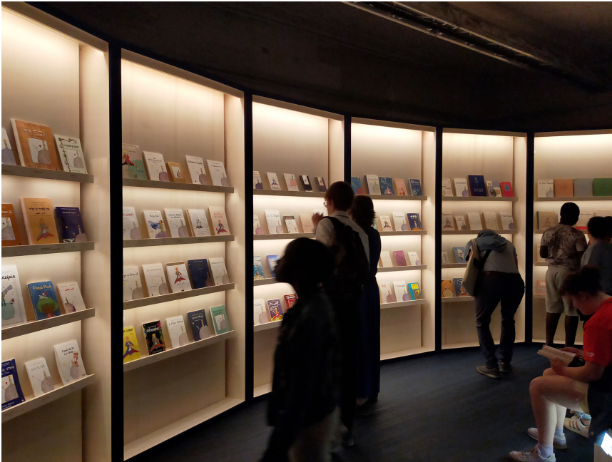
Fig. 1. « La bibliothèque universelle » : présentation de différentes traductions du Petit Prince .

par une accumulation de plusieurs dizaines de traductions de l'ouvrage 7 (fig. 1), en passant par le rôle d'Antoine de Saint-Exupéry dans les débuts de l'aviation et son engagement pendant la Seconde Guerre mondiale.