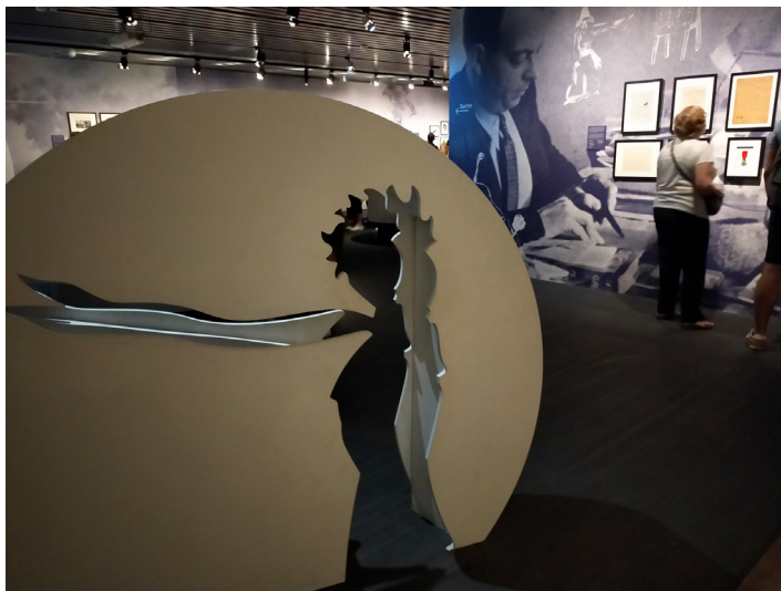
Fig. 4. La silhouette du Petit Prince.