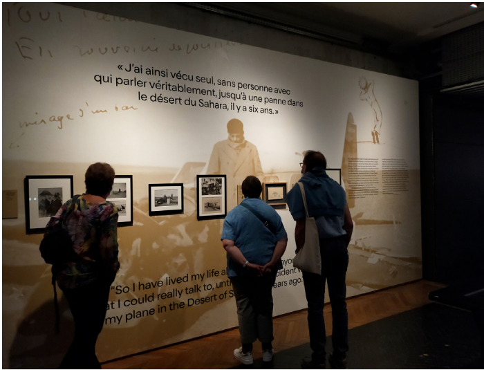
Fig. 3. Panneau d'introduction de la troisième séquence de l'exposition.

Certes, quelques créations scénographiques évoquent le roman et son célèbre personnage mis en avant par le MAD dans le titre même de l'exposition, telles cette silhouette du Petit Prince découpée en creux (fig. 4), une caisse dont les trous permettent de deviner le mouton caché à l'intérieur ou encore des vitrines aux formes circulaires, dont la rotondité n'est pas sans rappeler les nombreuses planètes que découvre le petit héros au cours de son aventure. Mais l'exposition repose surtout sur une série d'objets-traces, de reliques portant témoignage de la vie et du travail de l'écrivain : une table sur laquelle Antoine de Saint-Exupéry a gravé une première esquisse du Petit Prince, ses objets d'écriture (son stylo plume, son carton à dessin ou sa machine à