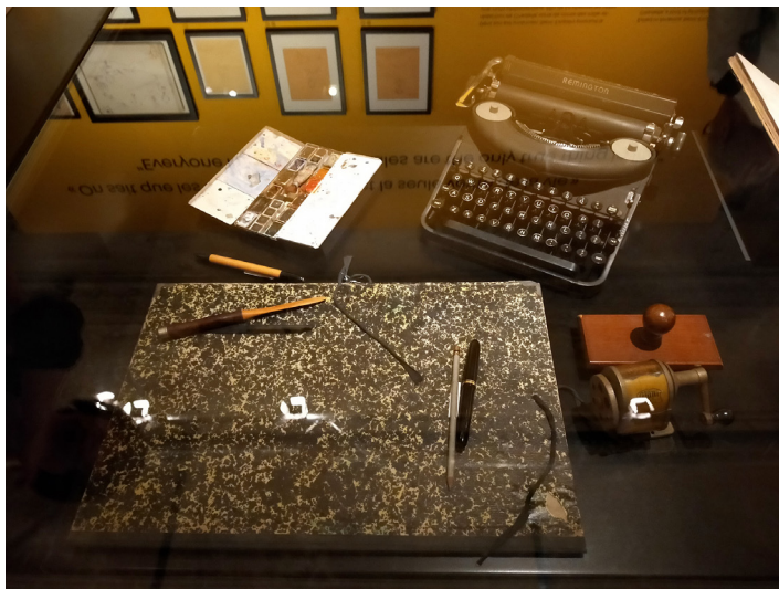
Fig. 5. Les objets d'écriture d'Antoine de Saint-Exupéry.