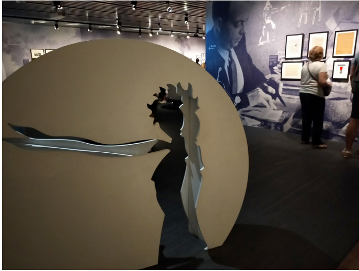
Fig. 4. La silhouette du Petit Prince. Photo J. de Bideran © Musée des arts décoratifs.