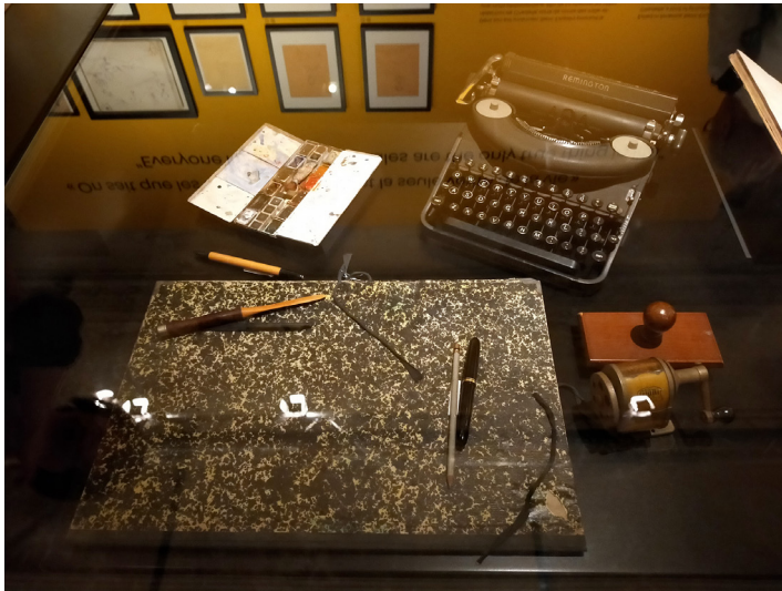
Fig. 5. Les objets d'écriture d'Antoine de Saint-Exupéry.