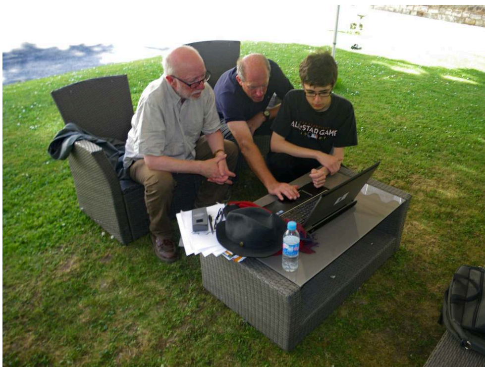
Fig. 4 – Phase d’interprétation en commun entre archéologues et géophysiciens (abbaye de Saint-Riquier dans la Somme).