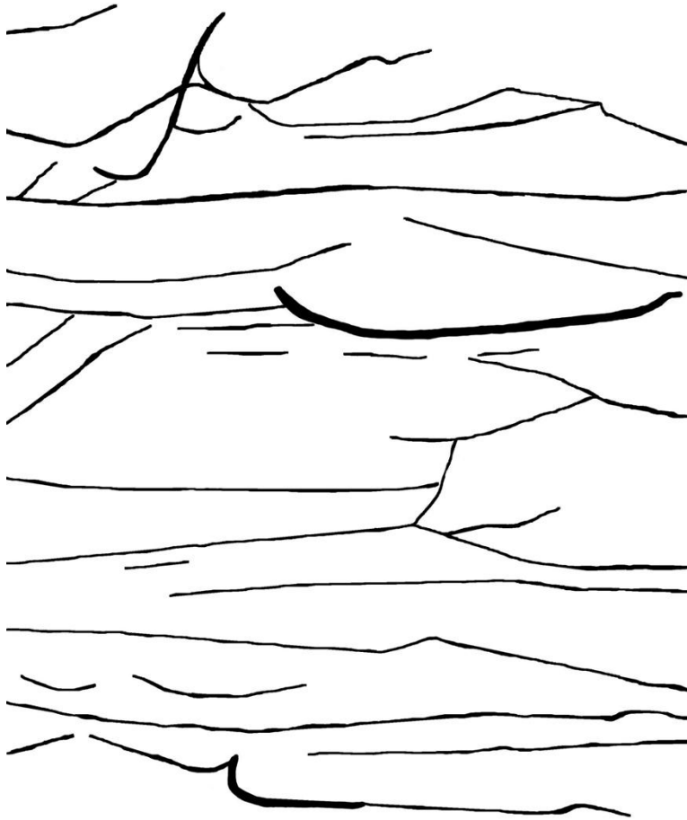
Illustration MdL : 47

Où l'on ne reconnaît pas le réel auquel était attaché ce document iconographique, mais où l'on peut tout de même imaginer, à partir de la rencontre des lignes, épaisses ou fines, de leurs formes, quelque chose qui est de l'ordre de l'empilement, de la superposition, de l'écrasement ou de la fêlure.