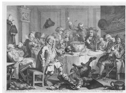
A Midnight Modern Conversation – W. Hogarth

Dès la fin des années 1960 apparaît dans une enquête américaine une définition du binge drinking comme étant la consommation d’au moins 5 verres d’alcool en une seule occasion (4). En 1994, l’École de santé publique de Harvard définit le binge drinking comme la consommation d’au moins 5 verres (5+) chez les garçons et 4 verres (4+) chez les filles par occasion (5+/4+) pendant les deux dernières semaines écoulées. Cette définition tient compte de