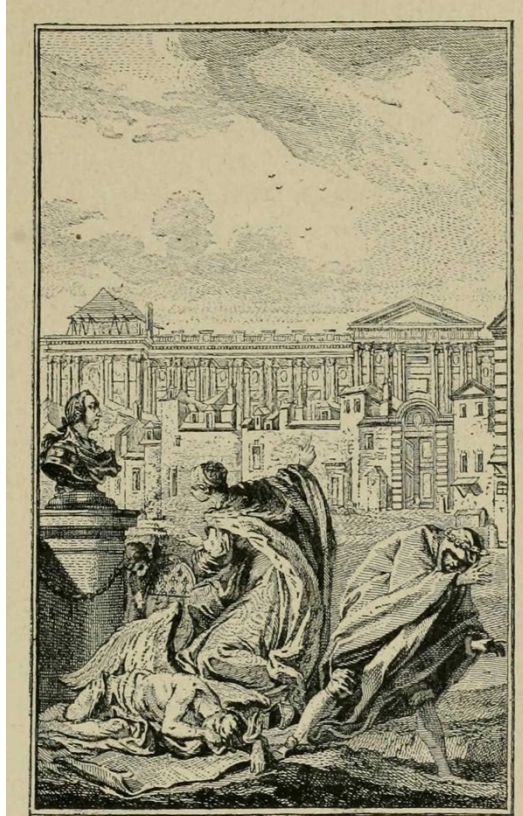
Frontispice de l'Ombre du grand Colbert , gravé par Eisen. La ville de Paris montre à Louis XV la colonnade du Louvre. A ses pieds, le génie du Louvre « écrasé sous le poids de l'humiliation »; à droite, l'ombre de Colbert, « foudroyé par l'aspect de l'état présent du Louvre ».