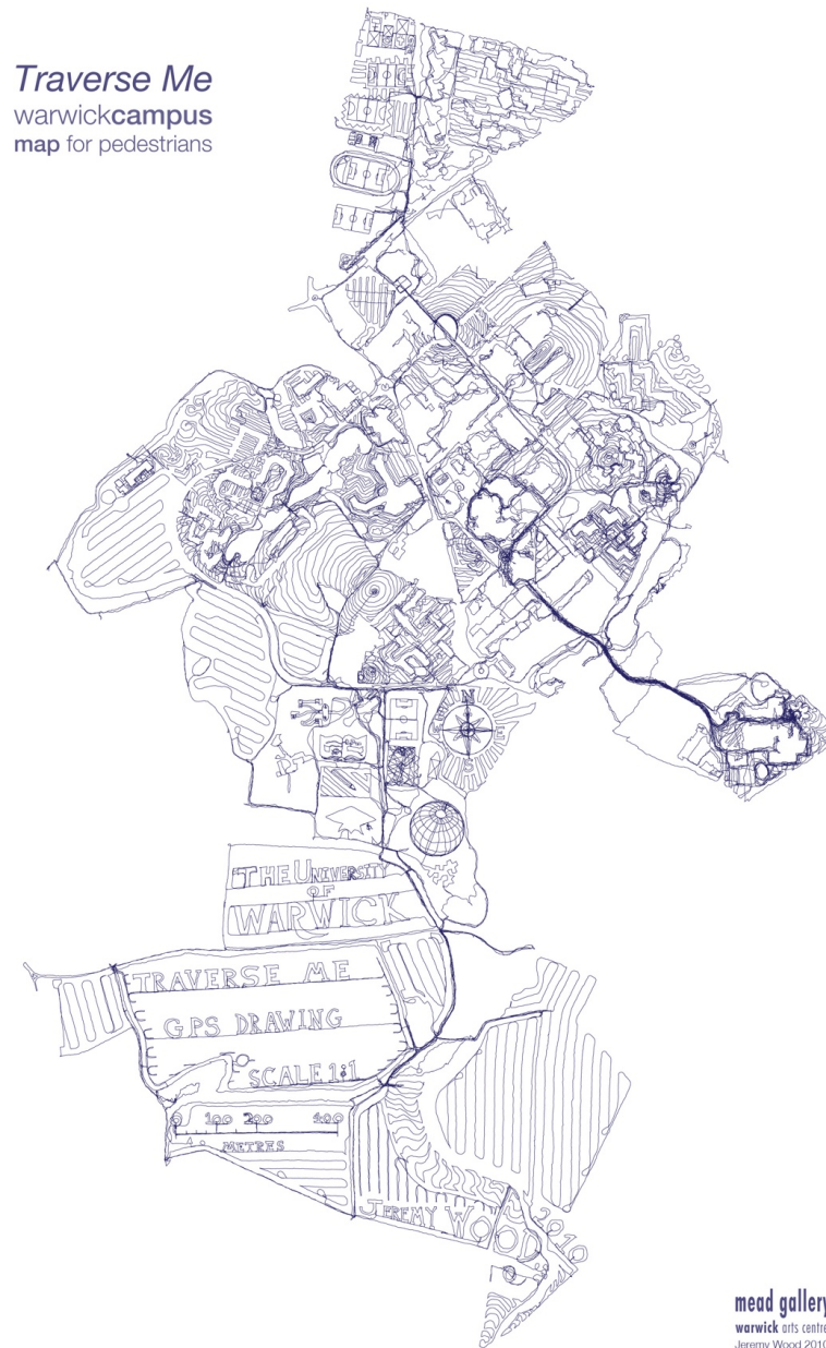
Fig. 3. Jeremy Wood, Traverse me . Warwick campus map, impression jet d'encre sur papier, 1 : 12000, 21 x 29,7 cm.

performatif relève de l'auto-observation propre aux pratiques de l'enregistrement et à la diffusion des tracés GPS qui, bien qu'ils soient issus d'une captation d'un satellite, autrement dit, vus d'en haut, n'en relèvent pas moins d'une esthétique horizontale du chemin de traverse et autres lignes d'erre ou de désir qui inspirent aussi bien les géographes que les psychiatres, les urbanistes que les artistes.