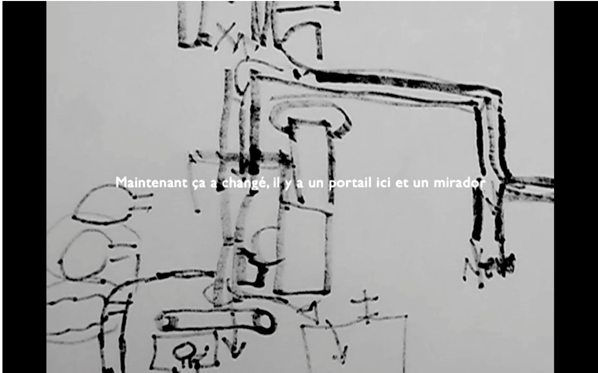
Fig. 1. Till Roeskens, Vidéocartographies , 2009. DV, 46 min. Film visible ici : https://vimeo.com/64089801?login=true

(2009) dans lequel, pendant 46 minutes, un plan fixe sur des cartes en train de se dessiner accompagne le récit oral et retranscrit à l'écran des habitants du camp de Aïda, à Bethléem, invités à décrire, par ce moyen, leur histoire dans le lieu qui les entoure 6 [Fig. 1].