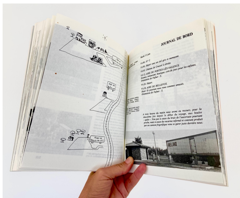
Fig. 4. Photographie des pages 214 et 215 de l'édition française de Les Autonautes de la cosmoroute ou un voyage intemporel Paris-Marseille de Carol Dunlop et Julio Cortázar, traduit de l'espagnol (Argentine) par Laure Bataillon, Paris, Gallimard, coll. « Du monde entier », 1983.

peut conditionner des formes d'écriture – on pense par exemple à la forme particulièrement « cartographique » de certains textes de Walter Benjamin qui a souvent recours à la constellation pour dresser le projet de ses textes. Avec l'association de l'image satellitaire, Street View et les outils de géolocalisation, la carte atteint aujourd'hui une forme particulièrement élaborée de dispositif et renouvelle les outils de construction du récit contemporain. Certes, les liens très anciens qu'entretiennent la littérature et la cartographie ne sont plus à démontrer et, à l'heure où j'évoque brièvement les pratiques de la cartographie sensible, je ne peux m'empêcher de penser aux cartes dessinées par Stéphane Hébert pour Les Autonautes de la cosmoroute : ou un voyage intemporel Paris-Marseille de Carole Dunlop et Julio Cortázar et qui ont tant inspiré les artistes contemporains de l'itinérance [Fig. 4]. En évoquant le dispositif cartographique dans le roman contemporain, je ne pense cependant pas aux cartes qui ont été reproduites ou créées spécifiquement pour des récits, mais davantage à l'écriture d'un Philippe Vasset 15 lorsqu'il se livre à ses explorations urbaines, aux romans de Jean Echenoz 16 ou encore à deux romans parus en 2022 sous la plume de Nina Leger et Lucie Rico.