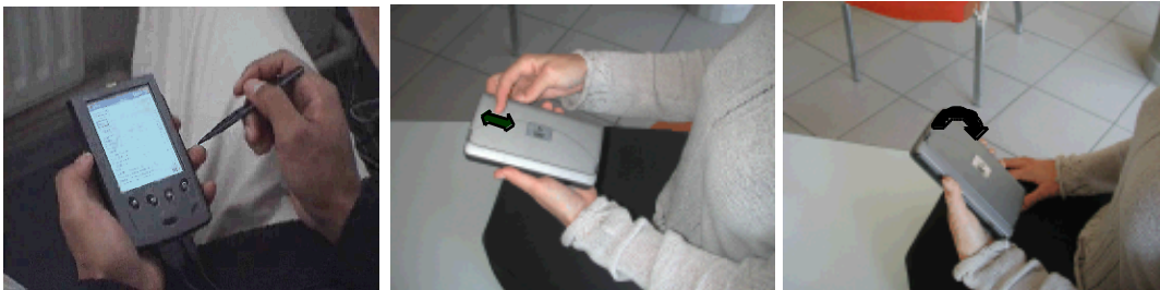
Figure 1 : Mise en œuvre des modalités tactile, gestuelle et "embodied" .

Seule la modalité tactile était réellement implémentée, les autres modalités étaient simulées par le compère grâce à une interface identique et un système de vidéo numérique.