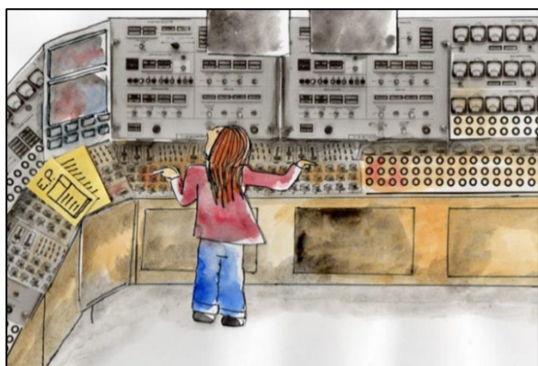
Fig. 1. Illustration d'une opératrice réalisant un Essai Périodique en centrale nucléaire