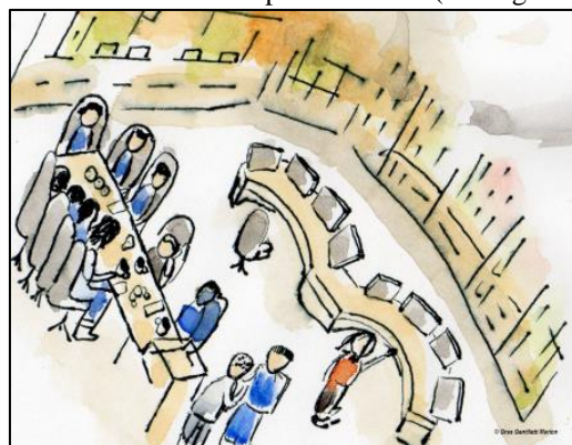
Fig. 3. Illustration d'un débriefing d'opérateurs associée au récit expérientiel n°1 (Cf. Fig. 6)

ergonome dans le récit expérientiel n°1 (Cf. Fig. 3 et 6).