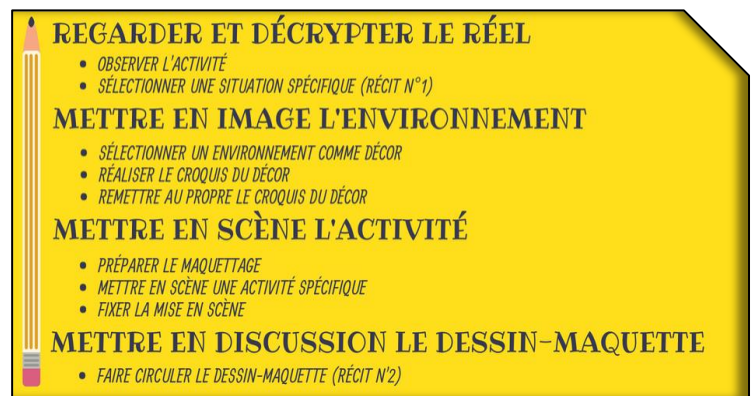
Fig. 6. Identification des étapes du processus de création