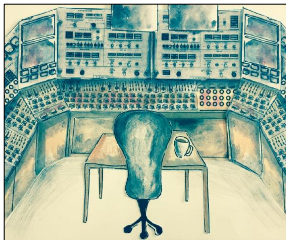
Fig. 2. Illustration d'une salle de commande automatisée

données – durant laquelle le dessin est un point d'ancrage – et lors des restitutions. D'abord, il offre un cliché subjectif d'une situation singulière à un instant donné avec une focale sur les éléments pertinents de l'activité. En effet, à plusieurs reprises, l'auteure précise qu'elle vise à illustrer un écart perçu entre l'activité réelle et la tâche prescrite. Elle veut : « montrer au maximum le travail réel [mais aussi que l'opératrice] est censée appliquer consigne après consigne, et [...] qu'en réalité, elle s'octroie des marges de manœuvre. [L'opératrice] s'en rappelle l'avoir déjà fait donc elle sait où se trouvent les boutons, où se trouve le matériel ». Différents niveaux de granularité accompagnent donc la lecture qui s'en trouve démultipliée. D'autre part, sans équipement additionnel, les dessins demeurent polysémiques et véhiculent différents messages. Le dessin illustrant la première page du mémoire a ainsi été volontairement mis en circulation sans être équipé, induisant tantôt une salle de commande tellement automatisée que les humains l'ont désertée, tantôt une salle de commande avec une si grande diversité de tableaux de commande que l'humain n'a pas le temps de boire son café (Cf. Fig. 2). Cette polysémie converge généralement vers un message central : ici, rappeler l'importance de la présence humaine dans un domaine technocentré.