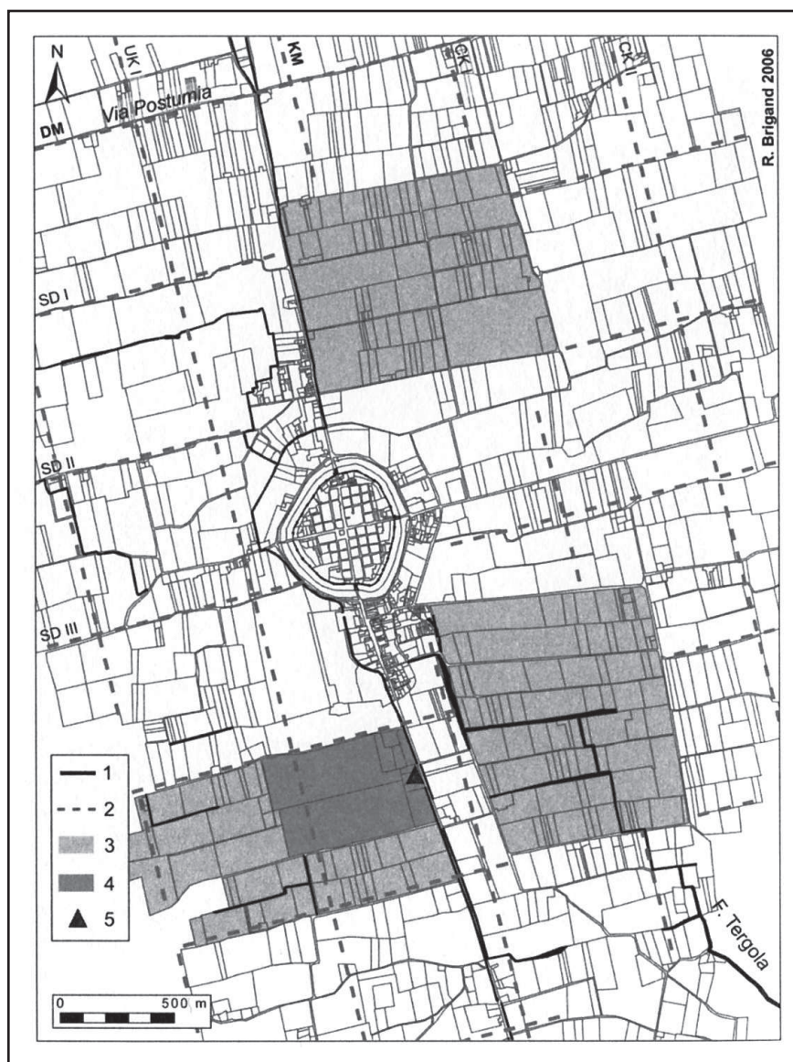
Fig. 3. Il tessuto parcellare del territorio di Cittadella (da Brigand 2006).