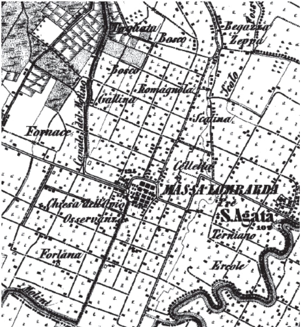
Fig. 2. Il territorio di Massa Lombarda in una carta topografica del XIX secolo.

bandono. È evidente che nel primo caso ci sarebbe un legame diretto, di causa-effetto, tra la nascita del centro medievale e la “nuova” sistemazione del territorio, mentre nel secondo caso non ci sarebbe necessariamente un legame tra la fondazione della villanova e il disegno del parcellare. Anche l'eventuale presenza, come a Cittadella (fig. 3), centro fondato da Padova nel 1220, di settori, comunque estremamente limitati, con orientamenti più