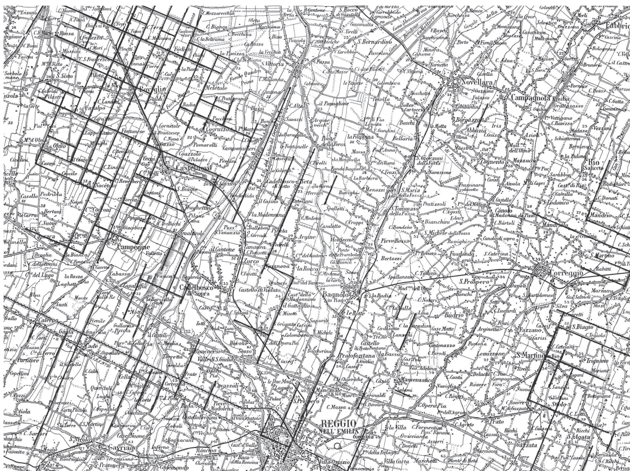
Fig. 1. Le “persistenze” della centuriazione romana nella pianura a nord di Reggio Emilia. L’area corrispondente all’antica palude (Gurgum) appare totalmente priva di segni riconducibili all’organizzazione di età romana (da Franceschelli 2008).

rubriche sono significative e importanti ai nostri fini, perché mostrano, una volta di più, come sia nel caso delle paludi parmensi, sia in quello della più vasta palude reggiana, il loro recupero avvenga ad opera di privati. Il Comune dà l’input, ma non stabilisce il piano e l’attuazione è lasciata ai privati, che la realizzano secondo le proprie esigenze e i propri tempi. Il risultato è dunque una “organizzazione volontaria” dello spazio (Abbé 2006, p. 17), cioè un disegno che è prodotto da una serie di interventi volontari di sistemazione del territorio che avvengono al di fuori di un qualsiasi piano unitario e, di conseguenza, al di fuori di una pianificazione territoriale.