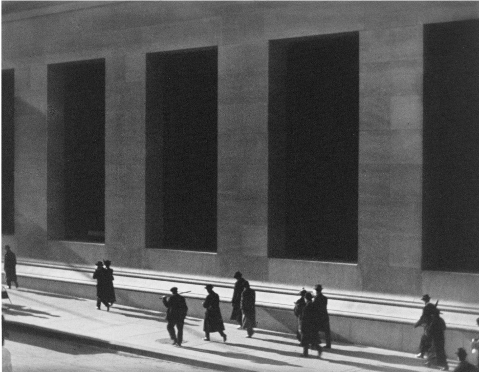
Fig. 3. Paul Strand. Wall Street, New York, 1915