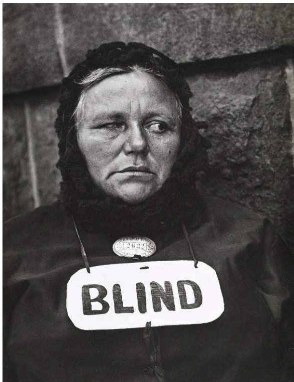
Fig. 1. Paul Strand. Blind Woman, New York, 1916