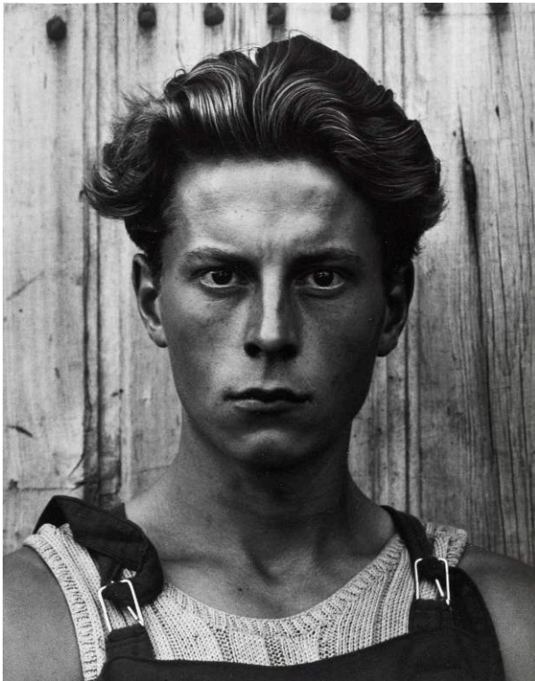
Fig. 6. Paul Strand. Young Boy, Gondeville, Charente, France, 1951