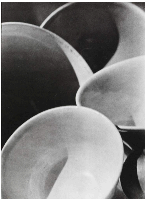
Fig. 4. Paul Strand. Abstraction, Bowls, Twin Lakes, Connecticut, 1916