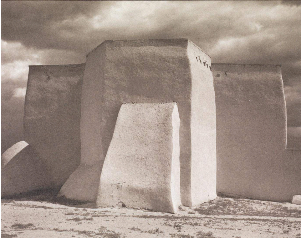
Fig. 5. Paul Strand. St. Francis Church, Ranchos de Taos, New Mexico, 1931