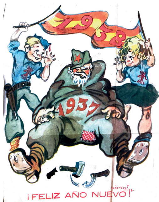
Fig.5. Couverture de Flecha Arriba España , n° 50, 1 er janvier 1938

Nous avons vu à travers l'étude de ce corpus que la vieillesse est représentée de différentes manières dans les livres scolaires et dans la presse pour enfants de l'époque, mais toutes ces représentations servent la propagande et l'idéologie du régime franquiste. Les enfants aidant leur prochain montrent l'image d'une Espagne