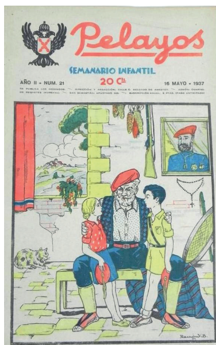
Fig.4. Couverture de Pelayos , n° 21, 16 mai 1937, ©Tebeosfera