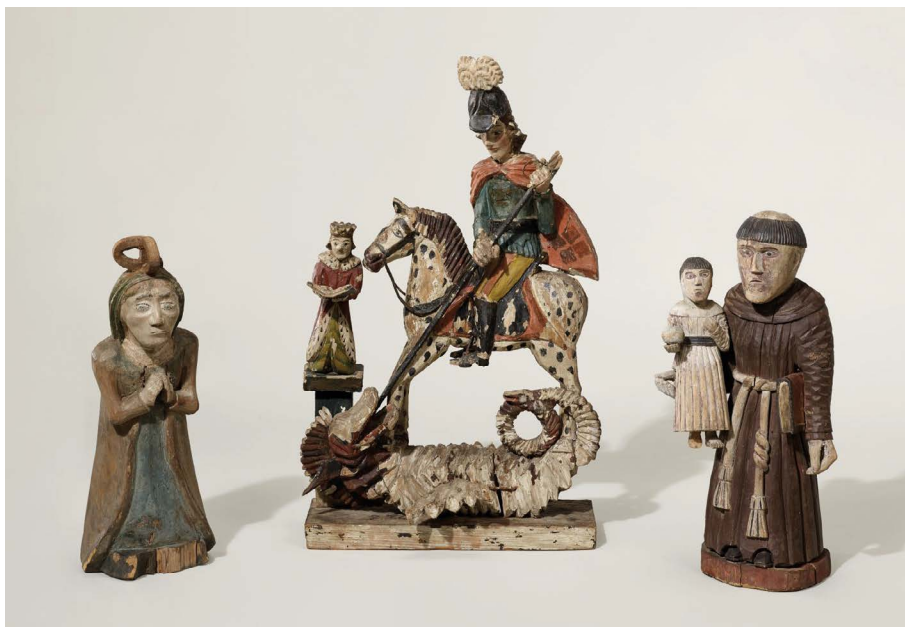
Fig. 4 : Saint Georges terrassant le dragon, Saint Antoine de Padoue et l'enfant Jésus, Vierge

Source : Lituanie, premier tiers du xx e siècle (?), bois sculpté et polychromé, 0,56 × 0,35 × 0,12 m, 0,39 × 0,19 × 0,18 m et 0,37 × 0,15 × 0,10 m, Marseille, Mucem, collection d'ethnologie d'Europe, dépôt du Museum national d'histoire naturelle, inv. DMH1934.135.31, DMH1934.135.32 et DMH1934.135.33