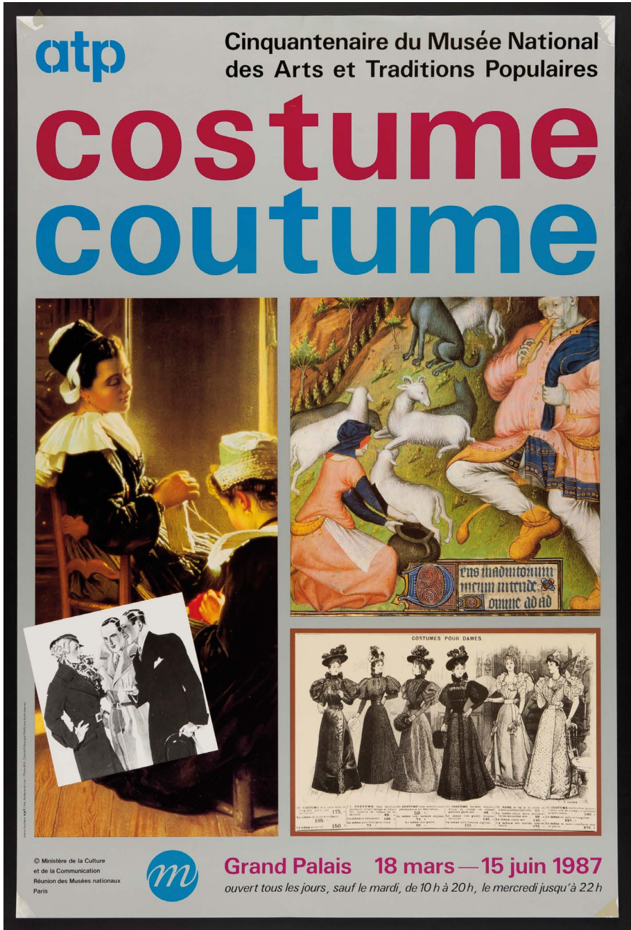
Fig. 9 : Pierre Fauchoux, affiche de l'exposition « Costume coutume » du MNATP, 1987