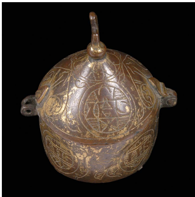
Fig. 3 : Pyxide, Limoges, xiii siècle, cuivre gravé, 10 × 6,5 cm, Marseille, Mucem, inv. 1885.1.10

Dans les années 1920 et 1930, Henri Focillon et son élève Jurgis Baltrušaitis, avant tout connus pour leurs travaux de médiévistes, s'intéressent au folklore et à l'art populaire en lien avec la question des survivances. Focillon y voit un exemple des phénomènes de sédimentation et de décalage chronologique qui sont au cœur de ses théories de l'histoire de l'art et de l'histoire des formes 18 , et identifie des « cultures du temps ralenti [...] naturellement caractérisées par les survivances, patois, croyances, folklores, usages, arts populaires 19 ». Pour lui, « le vaste royaume des arts populaires [...] n'est pas sans rappeler l'art de notre moyen âge et surtout l'art roman 20 ». En 1935, Baltrušaitis est responsable de la partie consacrée à sa Lituanie natale dans l'exposition d'art populaire baltique organisée au MET, et est à l'origine d'importants dons du musée de Kaunas et du gouvernement lituanien 21 . Il voit dans l'art populaire de son pays les traces de la culture antérieure à l'adoption officielle du christianisme à la fin du xiv siècle ; les motifs solaires sur les quenouilles ou les œufs peints sont selon lui les survivances d'anciens cultes rendus aux astres. Il estime que l'influence du Moyen Âge est prévalente sur la sculpture populaire (fig. 4), les thèmes iconographiques des xv et xvi siècles y étant conservés comme