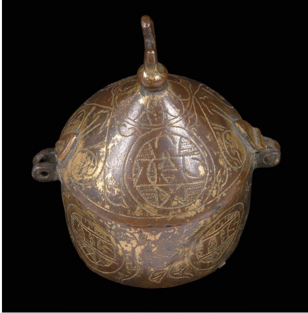
Fig. 3 : Pyxide, Limoges, XIII e siècle, cuivre gravé, 10 × 6,5 cm, Marseille, Mucem, inv. 1885.1.10

Dans les années 1920 et 1930, Henri Focillon et son élève Jurgis Baltrušaitis, avant tout connus pour leurs travaux de médiévistes, s'intéressent au folklore et à l'art populaire en lien avec la question des survivances. Focillon y voit un exemple des phénomènes de sédimentation et de décalage chronologique qui sont au cœur de ses théories de l'histoire de l'art et de l'histoire des formes 18 , et identifie des « cultures du temps ralenti [...] naturellement caractérisées par les survivances, patois, croyances, folklores, usages, arts populaires 19 ». Pour lui, « le vaste royaume des arts populaires [...] n'est pas sans rappeler l'art de notre moyen âge et surtout l'art roman 20 ». En 1935, Baltrušaitis est responsable de la partie consacrée à sa Lituanie natale dans l'exposition d'art populaire baltique organisée au MET, et est à l'origine d'importants dons du musée de Kaunas et du gouvernement lituanien 21 . Il voit dans l'art populaire de son pays les traces de la culture antérieure à l'adoption officielle du christianisme à la fin du XIV e siècle ; les motifs solaires sur les quenouilles ou les œufs peints sont selon lui les survivances d'anciens cultes rendus aux astres. Il estime que l'influence du Moyen Âge est prévalente sur la sculpture populaire (fig. 4), les thèmes iconographiques des XV e et XVI e siècles y étant conservés comme