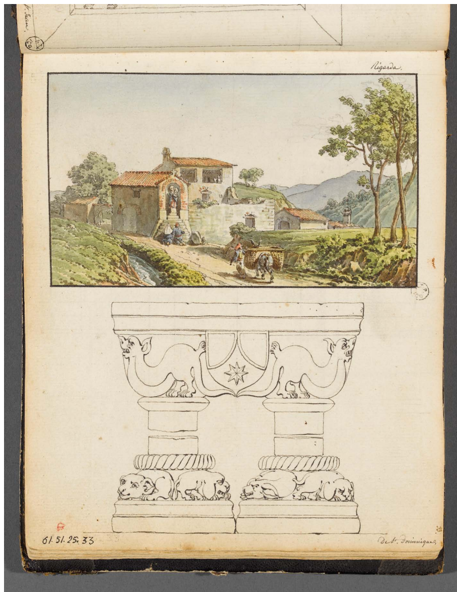
Fig. 1 : Charles Stanislas Lèveillé, Scène champêtre à Rigarda et relevé de colonnes et de chapiteaux du cloître de Saint-Dominique à Perpignan

Source : 1820, aquarelle et encre noire sur papier vergé, 22 × 18 cm, Marseille, Mucem, inv. 1961.51.25.33 © Mucem.