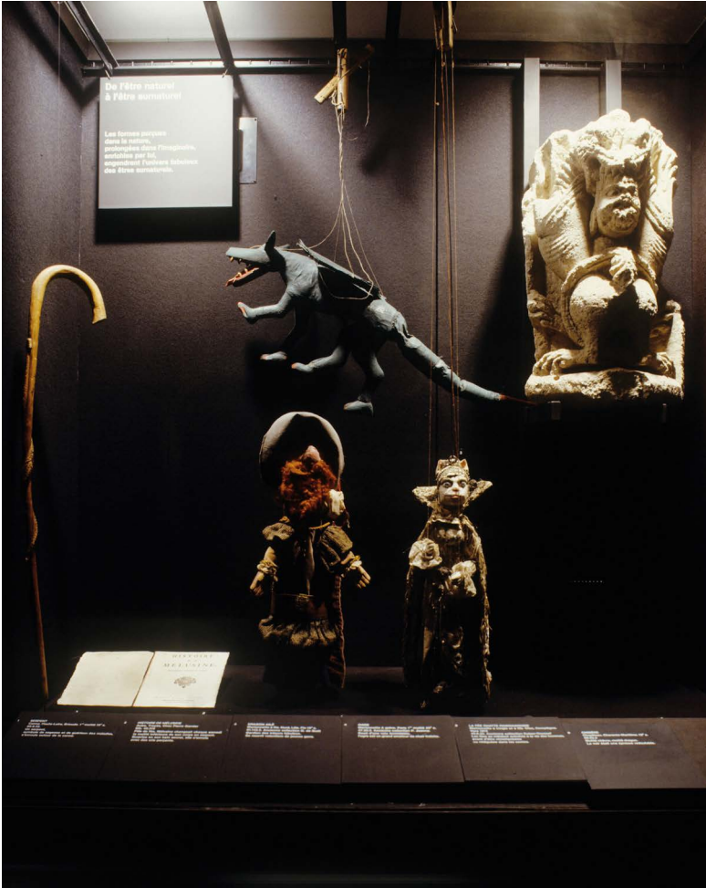
Fig. 7 : Vitrine « De l'être naturel à l'être surnaturel » dans la galerie culturelle du MNATP, Paris, 2005