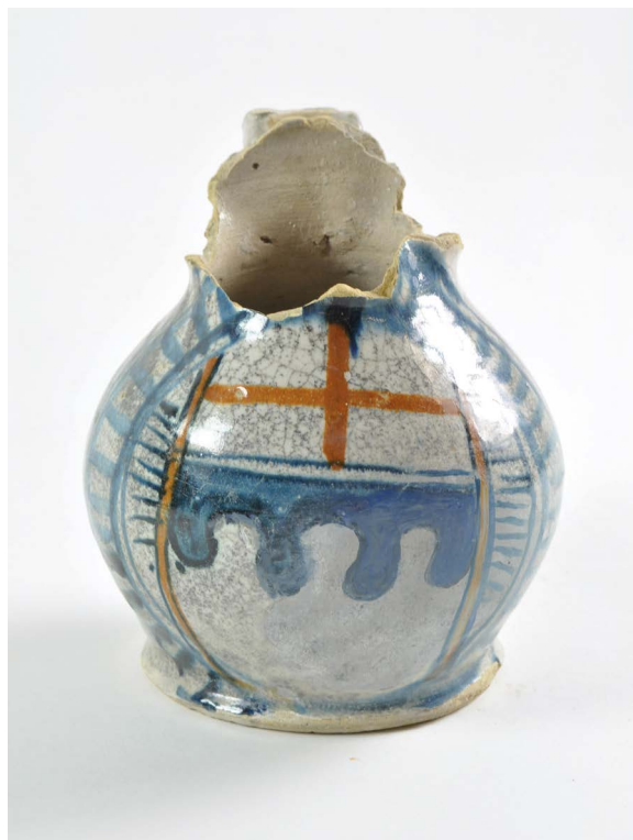
Fig. 10 : Pichet issu de la fouille de la Lomellina

Source : Ligurie, 1 er quart du xvi e siècle, terre cuite et émaillée, 16 × 14 cm, Marseille, Mucem, inv. 2000.1.2 © Mucem.