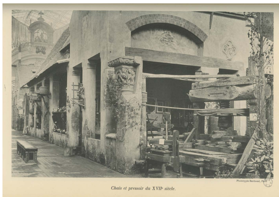
Fig. 2 : Phototypie Berthaud, Musée rétrospectif de l'agriculture à l'exposition universelle de 1900 , avec au premier plan le moulage du chapiteau des quatre Vents de Vézelay, provenant du musée de Sculpture comparée

Source : photographie publiée dans Jules Sain, Musée rétrospectif du groupe VII, agriculture , Paris, Belin frères, 1903. Marseille, Mucem © Mucem.