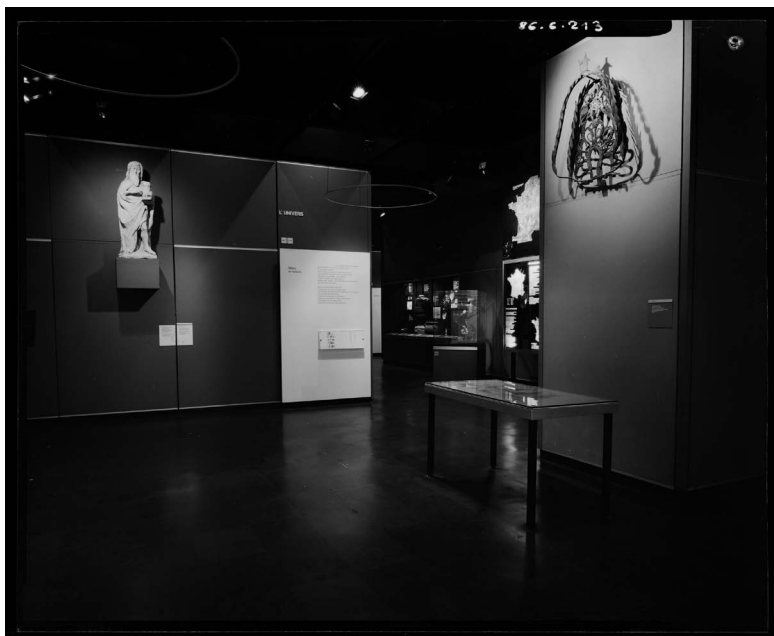
Fig. 6 : Vue générale de l'entrée de la galerie culturelle du MNATP, Paris, 1986

Source : photographie, Marseille, Mucem, inv. Ph.1986.6.213 © Mucem/André Pelle.