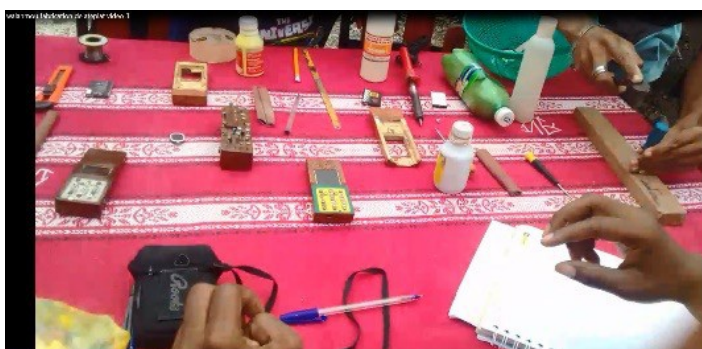
Figure 2 : le téléphone Atè Plat

La production de Atè Plat résulte de la mixité d'une technologie extérieure avec un ensemble de pratiques et savoirs sociaux (les habitudes d'appels dans les campagnes), de technicités (menuiserie) et de matériaux à la fois locaux et étrangers (le bois, l'argile, des vis d'ordinateurs portables etc.). Ce processus d'hybridation représente un acte de réincarnation d'une technologie produite à l'extérieur en une création présentant une nouvelle identité mais qui garde, elle, les modalités et les fonctionnalités de la précédente.