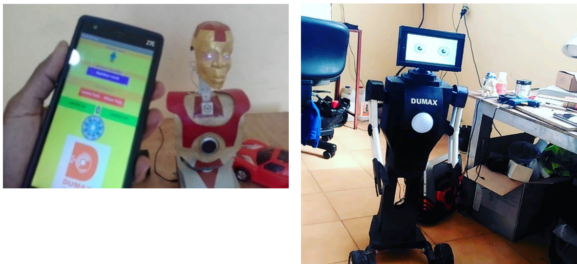
Figure 3 : le robot Dumax

Tout comme Walanmou, Dumax, le créateur du robot humanoïde est un autodidacte. Dans son atelier il utilise son téléphone pour apprendre la programmation et la conception informatique pour apprendre et réaliser son œuvre. Il a développé une application Android qu'il a installée sur son téléphone pour interagir avec lui.