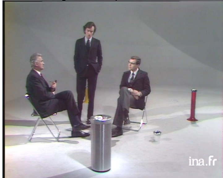
Copie d'écran de Papa retourne à l'école