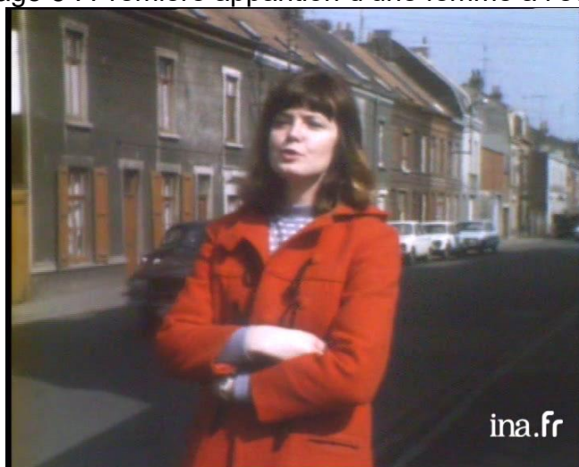
Copie d'écran de Papa retourne à l'école

Sa question n'en est pas une, c'est une interpellation assez vive et revendicative : Oui, une fois de plus, j'ai l'impression que la formation continue, c'est fait pour les hommes, quoi !