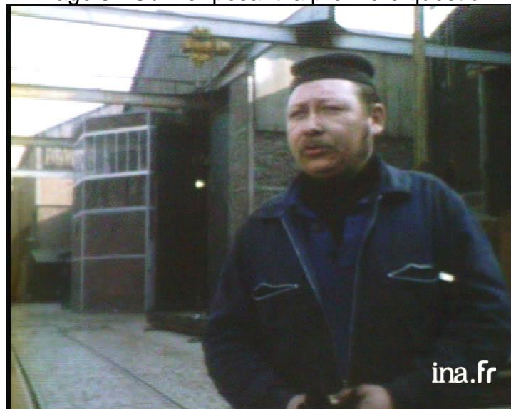
Copie d'écran de Papa retourne à l'école