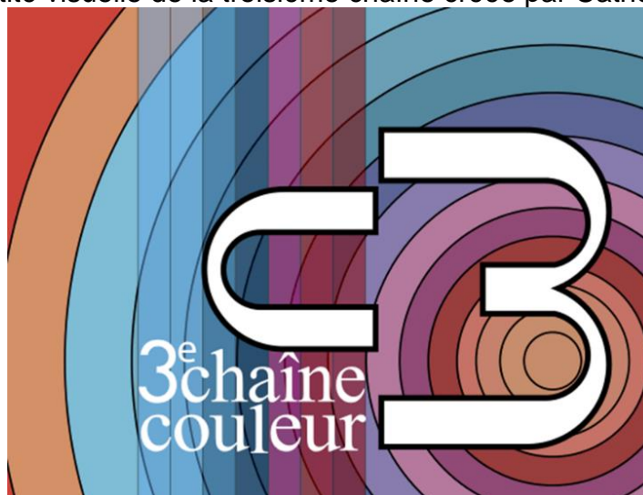
Image 2 : Identité visuelle de la troisième chaîne créée par Catherine CHAILLET