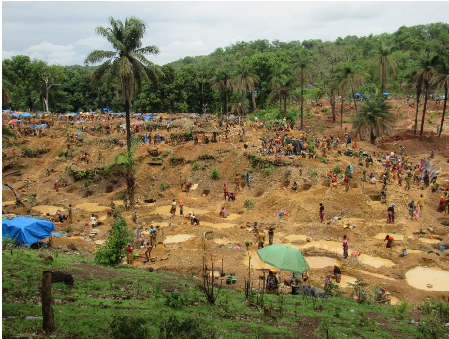
Figure 1. Site d'orpaillage en Guinée.

Petit-Roulet R. 1 , 2023, « Entre passivité, négociation et diffusion : rôles des orpailleurs mobiles dans la gouvernance des ressources en Guinée », Recherches-Ressources