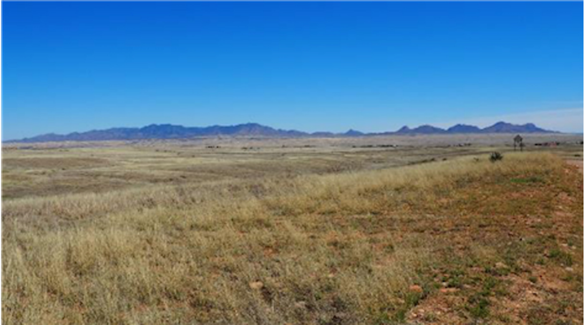
Fig. 2. La prairie de Las Cienegas.

programme de Ranch Land Management a malgré tout été élaboré au sein du SDCP avec les éleveurs invités à participer au comité de gestion du plan (Charnley et al. , 2014). Ce programme qui valorise les ranchs et les terres de pâturage comme aires de conservation repose non seulement sur un contrôle de la végétation par les ranchers pour le service Ressources naturelles et parcs du comté de Pima mais aussi sur une politique de rachat de terres et de servitudes environnementales incluant le droit de pâturage. Le comté de Pima rachète en effet les terres aux éleveurs et leur droit de pâturage sur les terres publiques sur lesquelles une opération de droit de développement ( development right ) est effectuée, cette dernière consistant à restreindre l'usage des terres aux «servitudes environnementales». Les terres perdent dès lors de leur valeur car elles ne sont plus aménageables ni constructibles et les éleveurs touchent en échange une compensation financière. L'opération de droit de développement se fait au travers d'un organisme tiers, l'Arizona Land and Water Trust (ALWT) qui finance les rachats de droits 14 , puis le comté rachète les terres et les droits de pâturage. Selon la responsable du Ranch Land Management au comté de Pima, «le rôle du programme est de racheter des terres et de faire coexister élevage et