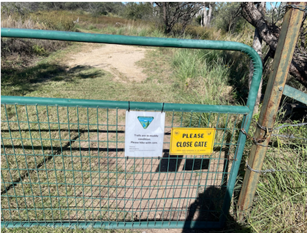
Fig. 3. Barrières à la Cienega Creek.

terme, basé sur la science, de la gestion des parcours et de la végétation riparienne pour obtenir une évaluation objective sur laquelle établir les décisions de gestion des terres». Depuis lors, un programme pilote ( monitoring program ) de cinq ans, qui montre que la présence des bêtes en hiver permet d'éviter l'érosion et de maintenir la stabilité des zones ripariennes, a été mis en place et donne des résultats encourageants. Pour effectuer le monitoring , le Forest Service et le CNF Sierra Vista Ranger District ont équipé la zone en puits, conduites d'eau et barrières –les ranchers réalisent le travail d'installation. Par ailleurs, les ranchers collaborent avec l'Université d'Arizona à Tucson pour un Sustainable Ranch Land Management Program. Ils travaillent ainsi à la modification du modèle du pâturage pour implanter un monitoring program susceptible d'augmenter l'eau disponible et les enclosures sur 55 000 acres. Ce programme qui promeut de nouvelles pratiques intégrant le savoir des ranchers reçoit à la fois de l'argent d'agences fédérales et étatiques (Clean Water Act, le département de l'agriculture, l'Arizona Game and Fish Department).