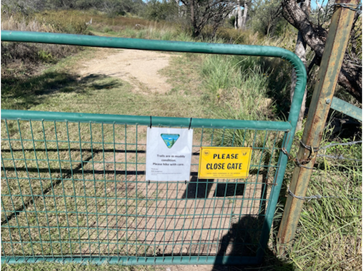
Fig. 3. Barrières à la Cienega Creek.

terme, basé sur la science, de la gestion des parcours et de la végétation riparienne pour obtenir une évaluation objective sur laquelle établir les décisions de gestion des terres». Depuis lors, un programme pilote ( monitoring program ) de cinq ans, qui montre que la présence des bêtes en hiver permet d'éviter l'érosion et de maintenir la stabilité des zones ripariennes, a été mis en place et donne des résultats encourageants. Pour effectuer le monitoring , le Forest Service et le CNF Sierra Vista Ranger District ont équipé la zone en puits, conduites d'eau et barrières –les ranchers réalisent le travail d'installation. Par ailleurs, les ranchers collaborent avec l'Université d'Arizona à Tucson pour un Sustainable Ranch Land Management Program. Ils travaillent ainsi à la modification du modèle du pâturage pour implanter un monitoring program susceptible d'augmenter l'eau disponible et les enclosures sur 55 000 acres. Ce programme qui promeut de nouvelles pratiques intégrant le savoir des ranchers reçoit à la fois de l'argent d'agences fédérales et étatiques (Clean Water Act, le département de l'agriculture, l'Arizona Game and Fish Department).