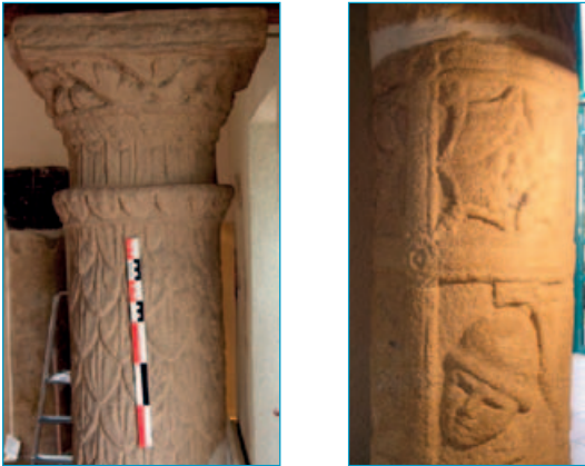
Fig. 2, a et b, Colonne à décor discontinu et panneaux cloisonnés provenant de la domus de Cheberne.

privatif. Les fouilles dirigées par Jérôme Hénique (Hadès) proposent la construction de cette vaste demeure, au milieu du I er siècle de notre ère. Elle se développe pendant tout le II e siècle puis semble périr au III e siècle (Fig. 1). On note cependant une réoccupation des espaces entre le IV e et le V e siècle avec l'installation d'ateliers sidérurgiques (forges). L'effondrement des bâtiments est effectif au V e siècle. (Fig. 2 a et b)