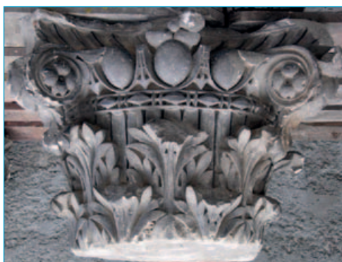
Fig. 4, Chapiteau composite retrouvé au XIX e siècle aux Thermes Sud. (Cliché Mathieu Dusséaux).

Blanc (en collaboration avec Laurent Lamoine de l'université Blaise Pascal - Clermont II), a entrepris ce travail de recensement des textes conservés. Les dédicaces de Nérus rappellent les largesses de ses notables, en particulier celles de Lucius Julius Equester et ces deux fils qui construisirent à leur frais les embellissements des thermes et des sources du dieu Nérius (Fig.3). L'étude des blocs architectoniques retrouvés depuis le XIX e siècle, va permettre une meilleure compréhension de la parure monumentale de la ville romaine. Elle est engagée par Mathieu Dusséaux dans le cadre de son master II, à l'université de Paris-Sorbonne. Des blocs décorés de masques scéniques, casques de gladiateurs et boucliers encadrés de rubans flottants retrouvés en 2011 dans le cadre de la fouille des Nériades de Claire Mitton (Hadès) sont à rapprocher des blocs découverts au XIX e siècle dans le même secteur et portant le même décor. De nombreux chapiteaux