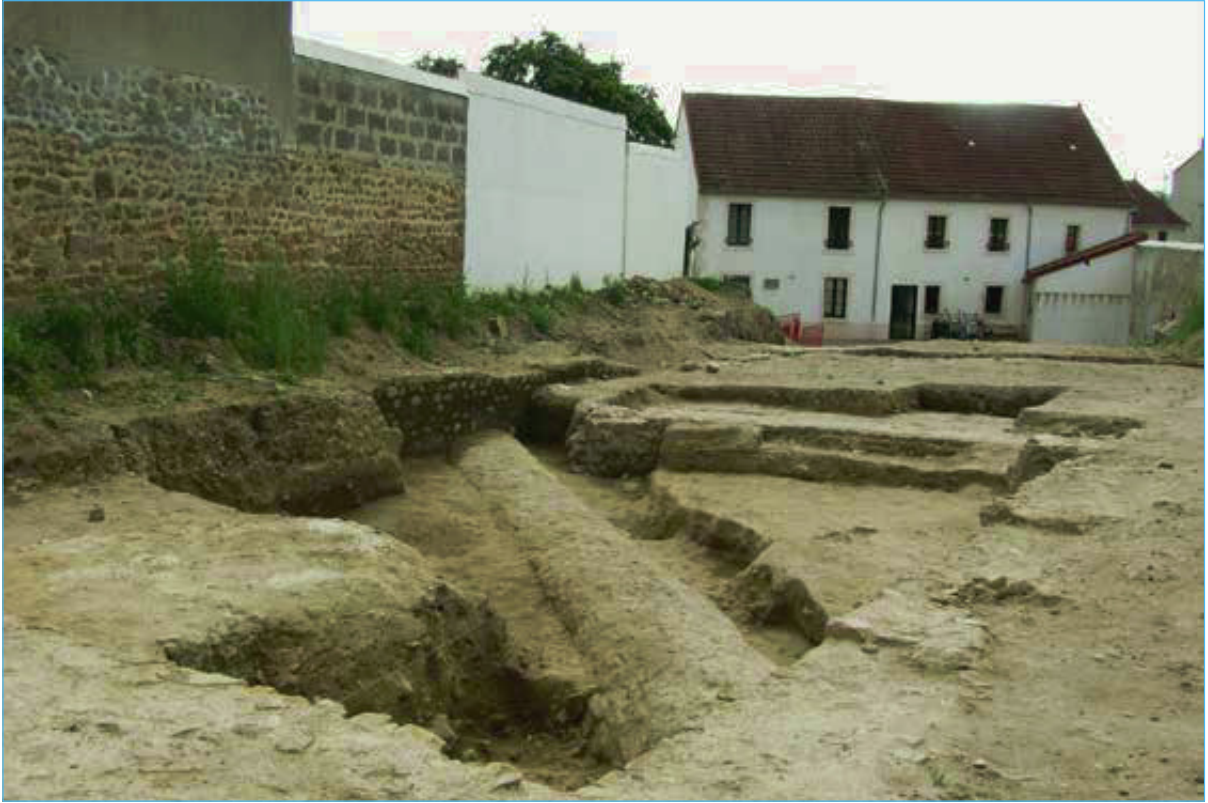
Fig. 4 : vue du conduit de l'aqueduc, chevauché par les murs qui définissent l'allée monumentale du complexe de phase II (cliché C. Franceschelli).

début du I er et le III e s. apr. J.-C. La phase I, qui commence à l'époque augustéenne et se termine entre fin I er - début II e siècle apr. J.-C., se caractérise par la présence de structures réalisées avec un mélange de matériaux durables et périssables. Les premiers ont été employés dans les fondations des murs (en moellons de pierre liés au mortier de chaux), dans les sols (en mortier de chaux) et dans les couvertures (en tuiles) ; les deuxièmes, en revanche, ont été employés dans les élévations des murs, réalisés en briques crues. Les quelques fenêtres ouvertes sur cette première phase de fréquentation, qui semble attestée sur la totalité de la parcelle, nous portent à proposer une fonction résidentielle et/ou artisanale.