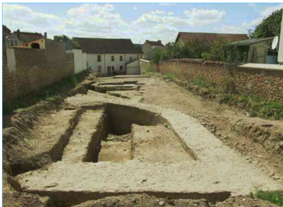
Fig. 3 : vue générale des structures fouillées pendant la campagne 2014.

Plus précisément, deux phases majeures de fréquentation se sont succédé pendant la période romaine, entre le