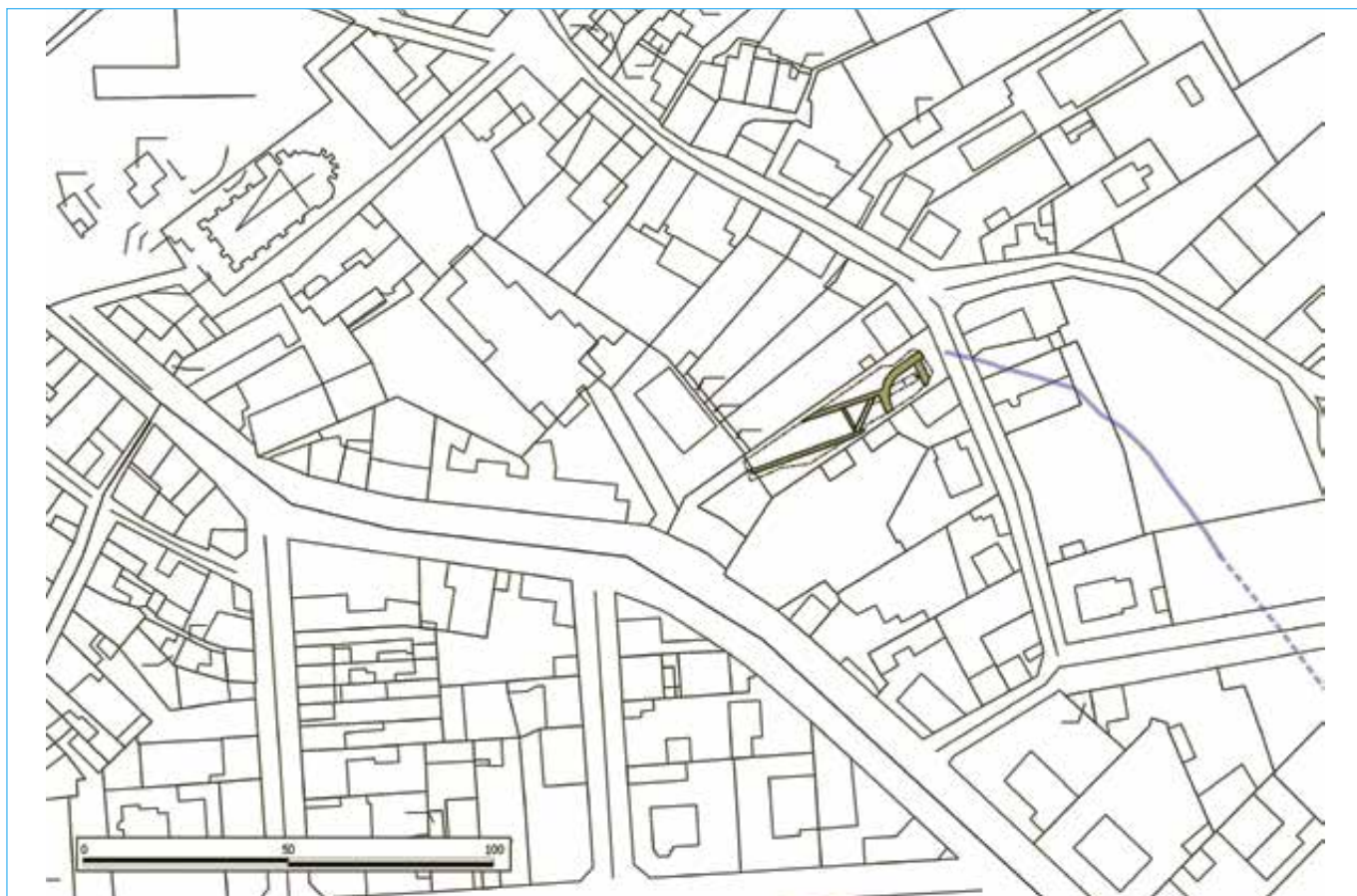
Fig. 1 : emplacement topographique de la parcelle située au 2 bis de rue Kléber, avec plan schématique des structures fouillées (Relevé et DAO C. Franceschelli et K. Ferrari)

La fouille de la parcelle située au numéro 2bis de la rue Kléber, propriété de la Mairie de Nérès-les-Bains, a été réalisée dans le cadre du PCR Neriomagus/Aquae Nerii . Elle s'inscrit dans un volet spécifique de ce programme, conduit depuis 2011 par une équipe franco-italienne et consacré au thème de l'alimentation en eau de la ville