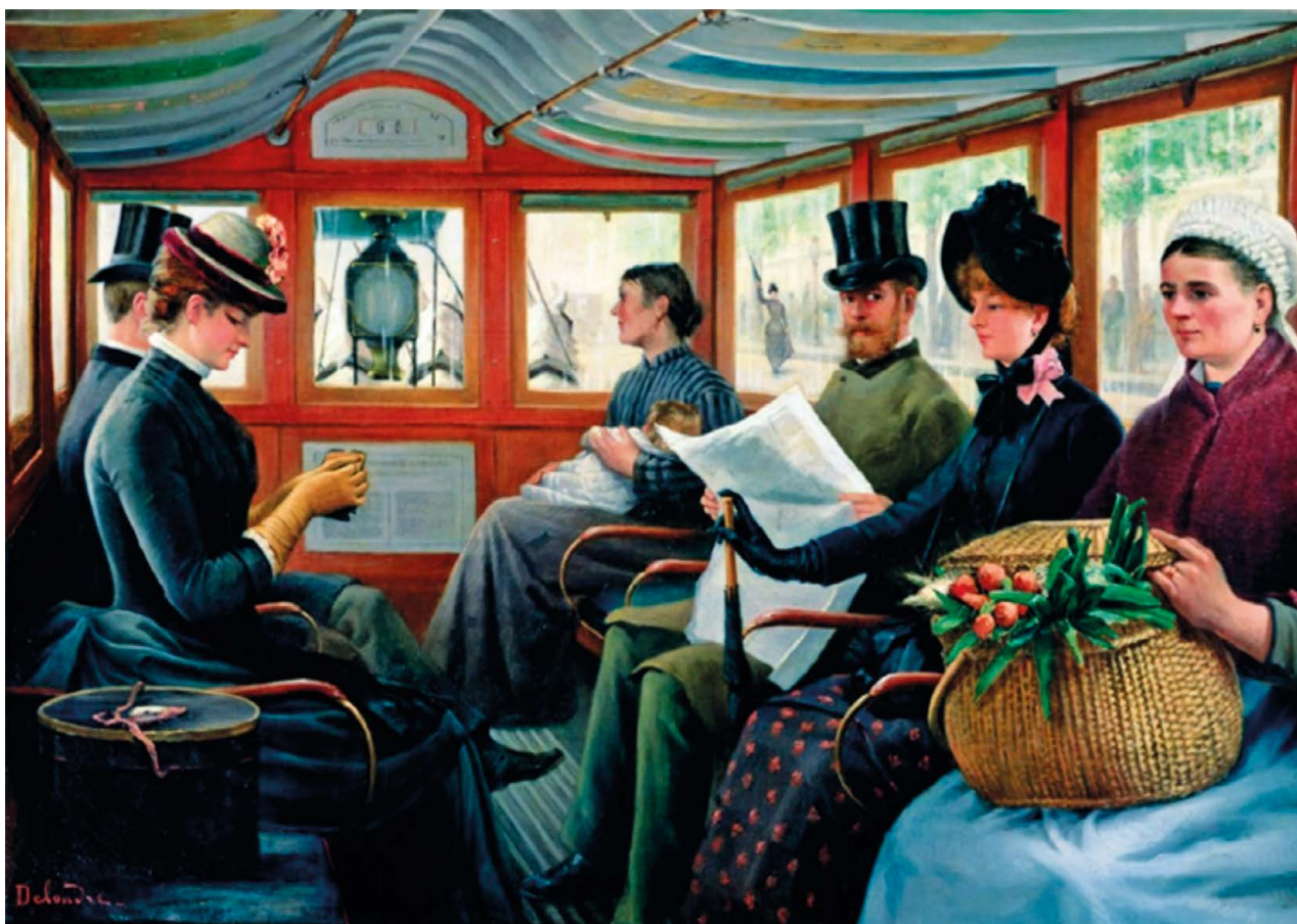
PL. 3. Maurice Delondre, Dans l'omnibus , vers 1885, huile sur toile, 66 x 94,5 cm. Musée Carnavalet, Paris