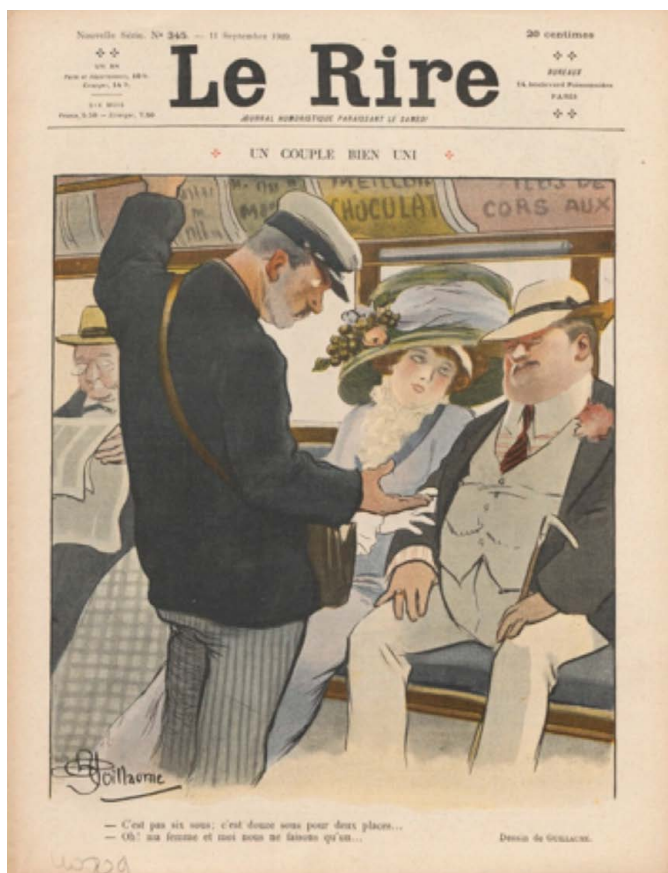
PL. 4. Albert Guillaume, « Un couple bien uni », Le Rire : journal humoristique , 345, 11 septembre 1909