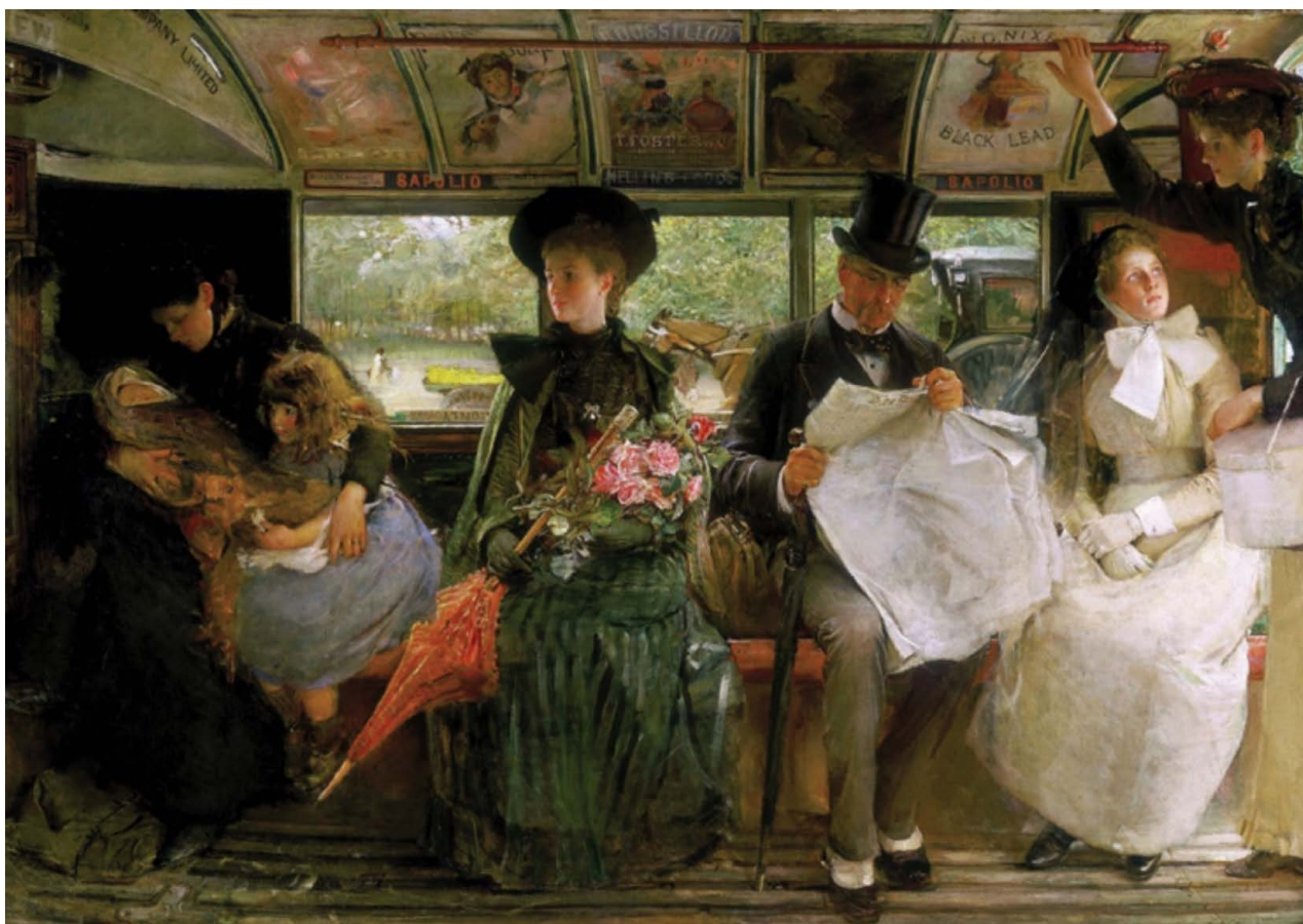
PL. 2. George William Joy, L'omnibus de Bayswater , 1895, huile sur toile, 120,6 x 170,5 cm. Museum of London, Londres