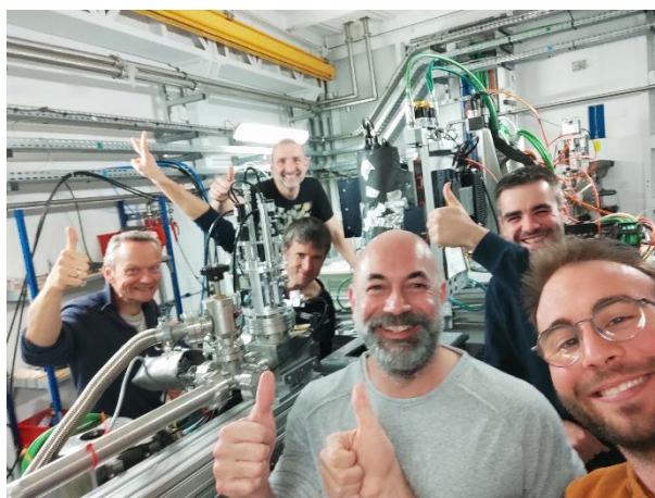
Fig. 3: L'équipe du GDR Sciences du bois dans la cabine de microtomographie de la ligne PSICHE du Synchrotron SOLEIL.

Dans un esprit de Sciences Ouverte, les fichiers sont ainsi mis à disposition, au fur et à mesure qu'ils sont traités, sur le serveur du GDR Sciences du Bois : https://www6.inrae.fr/gdr-sciences-du-bois . Des discussions sont aussi en cours pour un dépôt sur un entrepôt de données institutionnel ( https://entrepot.recherche.data.gouv.fr/ )