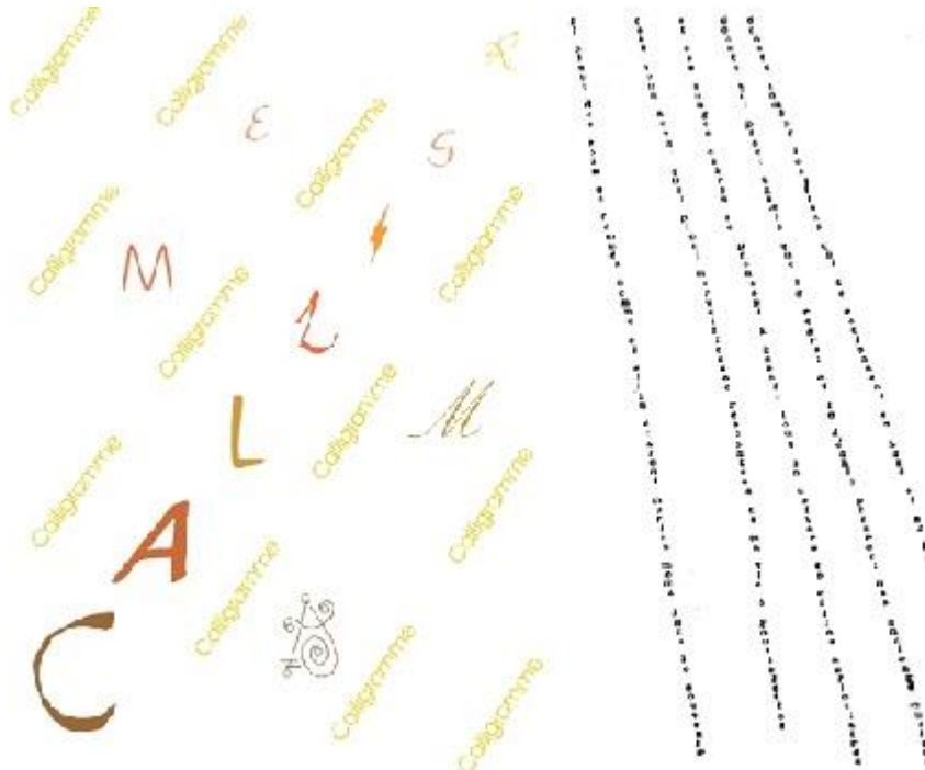
Yuri Gik, Calligramme et Apollinaire, IL PLEUT

et cubistes. Le poème visuel suivant a été réalisé d'après le motif du calligramme d'Apollinaire 5 qui lui est juxtaposé ci-dessous. La couleur, les expérimentations avec les caractères et le rythme du poème sont autant des moyens de rendre plus actuel ce poème devenu classique.