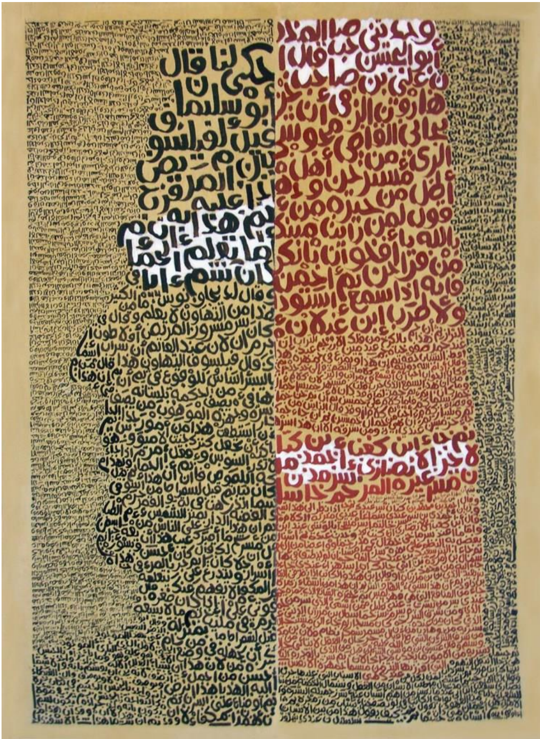
Imaginaire, encre sur argile, 75 x 63 cm, 2012

Ce type de silhouette, nous allons le retrouver dans une œuvre créée il y a dix ans, un triptyque qui, lui, n'a rien de mystique ni de philosophique. Il s'agit de l'hommage rendu par l'artiste à deux jeunes martyrs devenus, a posteriori, les « déclencheurs » des « Printemps arabes », l'Égyptien Khaled Saïd et le Tunisien Mohammed Bouazizi. Il peut sembler étonnant qu'un calligraphe épris de sacré