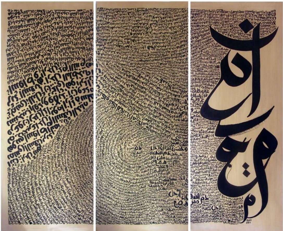
Taghrir Square , encre sur argile, 114 x 93 cm, 2011

Ce triptyque s'intitule Taghrir Square, du nom de la célèbre place du Caire où s'est déroulée en 2011 la majeure partie des manifestations qui en Égypte ont conduit au départ d'Hosni Mubarak. Les textes que j'ai écrits sur ces trois panneaux sont constitués des slogans qui ont été hurlés par les manifestants sur cette place. Le panneau de droite, lui, est principalement constitué d'un profil composé de lettres de l'alphabet arabe dont les deux premières sont le « alif » et le « bâ ». Ce « alif » et ce « bâ » forment une croix et un croissant représentant symboliquement les deux composantes culturelles de l'Égypte d'aujourd'hui.