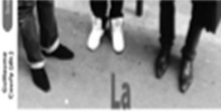
La mobilité dans le système scolaire

Après avoir lu les articles de ce numéro, on se rend compte que la recherche en éducation est un terrain de jeu passionnant et complexe. Les auteurs abordent des questions fondamentales sur la formation des enseignants, la professionnalité, la recherche-action, etc. C'est un plaisir de lire ces textes et de découvrir les réflexions de ces chercheurs. Bonne lecture !