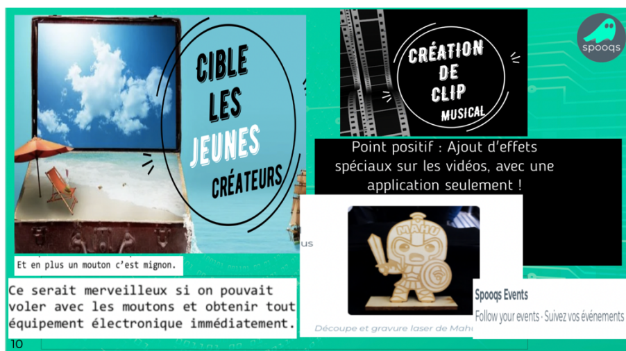
Figure 3. Mises en récit, créations sur SPOOQS

« reformulation créative » entre perception et interaction qui propose un regard sur la complexité des usages .