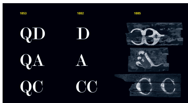
Fig. 2: Évolution de la marque des bateaux des ports de Douarnenez, Audierne et Concarneau. À droite, une forme courante donnée à ces marques à partir de 1885.

En Bretagne, comme ailleurs, le découpage administratif en quartiers et sous-quartiers maritimes variera au fil du temps, certains ports gagnant en autonomie à la faveur de l'essor de leurs pêches et de leur population, quand d'autres seront absorbés par plus grand qu'eux. Ainsi dans le Finistère, par exemple, la lettre initiale inscrite à l'avant des bateaux des flottilles de Douarnenez, Audierne ou Concarneau sera longtemps le "Q" de la grande ville de Quimper avant d'être convertie en celles que l'on connaît mieux grâce aux premières cartes postales, les iconiques "D", "A" ou "CC" [fig. 2].