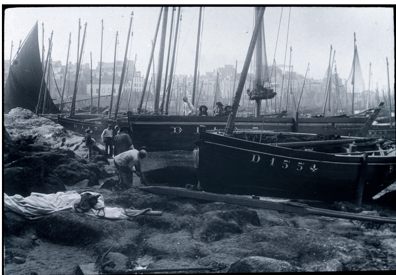
Fig. 1 : Robert Demachy, Marins préparant leurs bateaux sur la plage de Douarnenez, vers 1908, Musée Nicéphore Niépce, Chalon-sur-Saône.

Dans le Finistère, l'exercice atteint des sommets d'inventivité et d'exécution ; ce que l'on nommera plus tard le style « à barbes » s'impose, au tournant du siècle, comme la meilleure façon d'embellir les chaloupes sardinières sur une grande partie du littoral atlantique.