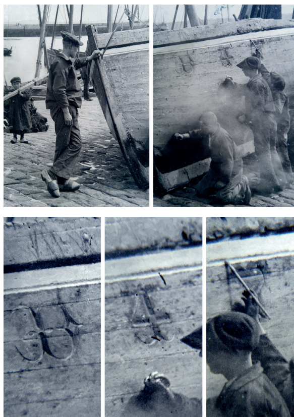
Fig. 3 : Jean-Marie Villard, Carénage d'une barque sur les quais, vers 1900, Archives départementales du Finistère.

gravure en V exécutée au ciseau – ou au fermail – qui a pour résultat un signe profondément creusé en biseau dans le bois. Sur les photographies, la lumière vient généralement frapper l'un des pans de cette vallée qui constitue le fût de la lettre, laissant l'autre versant, moins exposé, dans la pénombre. Grâce à cette technique, plus élaborée que la première, les signes de l'immatriculation apparaissent bicolores (combinant facettes blanches et ombrées, selon l'angle de réflexion de la lumière) et véritablement sculptés « en creux » [fig 3].