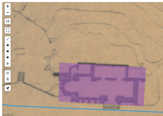
FIGURE 2. Deux annotations sur le Plan du cadastre de Estella (Chemin de St. Jacques), l'une porte sur un extrait du Chemin de St Jacques (en bleu) et l'autre désigne l'entité spatiale Église du Saint Sépulcre (en violet).

Un module d'annotation sémantique a été développé sous forme de plugin Omeka S 8 par D. Berthereau. Cette implémentation s'appuie sur les recommandations de la W3C qui conseille l'utilisation du Web annotation Data model (WADM) ainsi que l'ontologie associée, le Web Annotation Vocabulary (WAC). L'annotation est plus précisément définie comme une ressource composée d'un body qui correspond au commentaire ou à la ressource descriptive ainsi que d'une target qui constitue la ressource concernée par ce qui est décrit dans le body de l'annotation. L'annotation peut également être caractérisée par des propriétés additionnelles comme un type parmi celles répertoriées dans la WAC et un identifiant IRI ( Internationalized resource identifier ). En ce qui concerne la dimension spatiale, la target de l'annotation fait souvent référence à une géométrie exprimée en WKT afin de démarquer la zone concernée par l'annotation. Le body d'une annotation peut aussi pointer à une IRI d'un gazetier sémantisé externe comme Géonames ou bien interne au sien d'Omeka S, afin d'identifier le lieu dont il est question dans l'annotation. La figure 2 illustre deux annotations sur le plan du cadastre d'Estella, qui fait partie du fonds Chemin de St Jacques sur l'interface d'annotation que nous proposons.